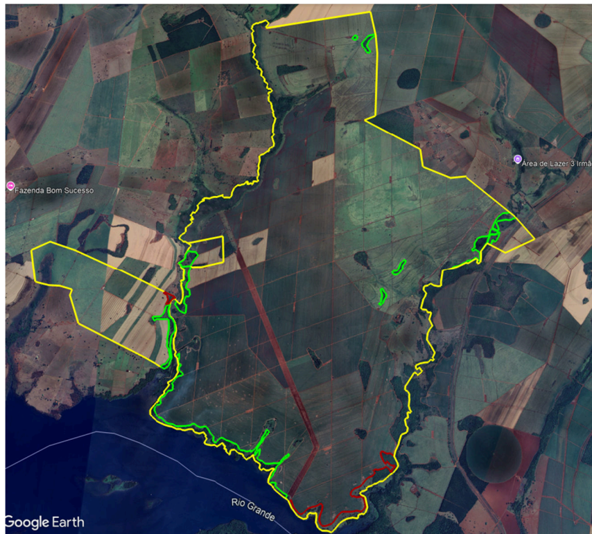
Figura 03. Perímetro da propriedade (amarelo) com a localização das áreas de recuperação - Reserva Legal - (verde: enriquecimento e vermelho: plantio de mudas direto).