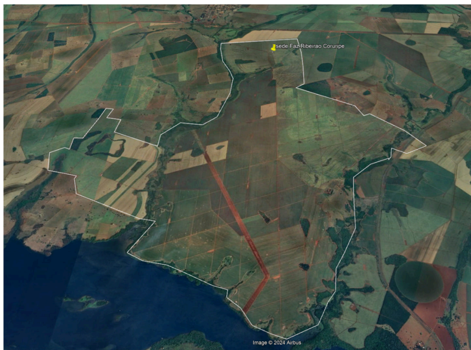
Figura 01. Delimitação da área do empreendimento (em branco).

A Fazenda Ribeirão localiza-se na zona rural, na do município de Iturama-MG. O acesso ao empreendimento pode ser realizado por meio da Rodovia BR-497 (Popularmente conhecida como Rodovia Uberlândia-Prata) partindo de Iturama, sentido Carneirinho, percorrer cerca de 27 km até o empreendimento