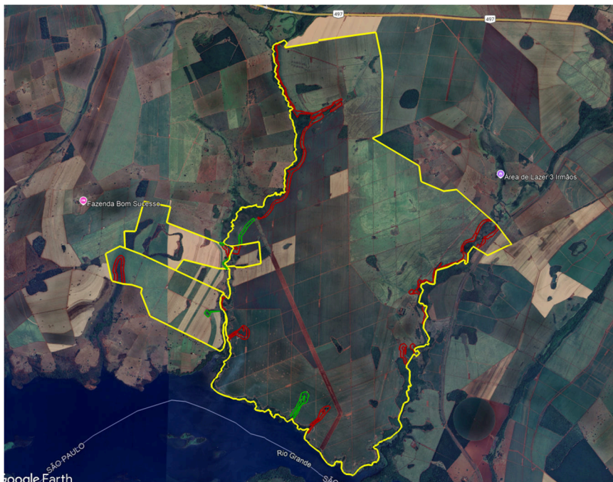
Figura 04. Perímetro da propriedade (amarelo) com a localização das áreas de recuperação - APP - (verde: enriquecimento e vermelho: plantio de mudas direto).