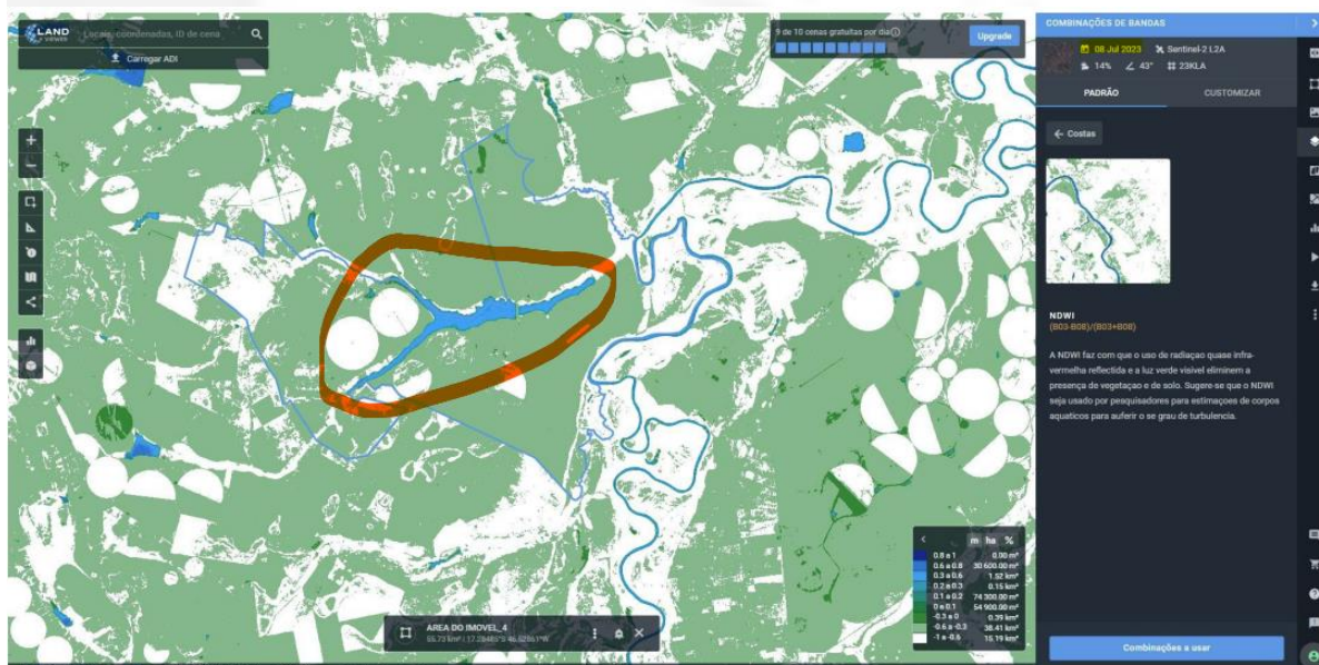
Figura 2. Imagem Sentinel-2 L2A de 08 de julho de 2023.