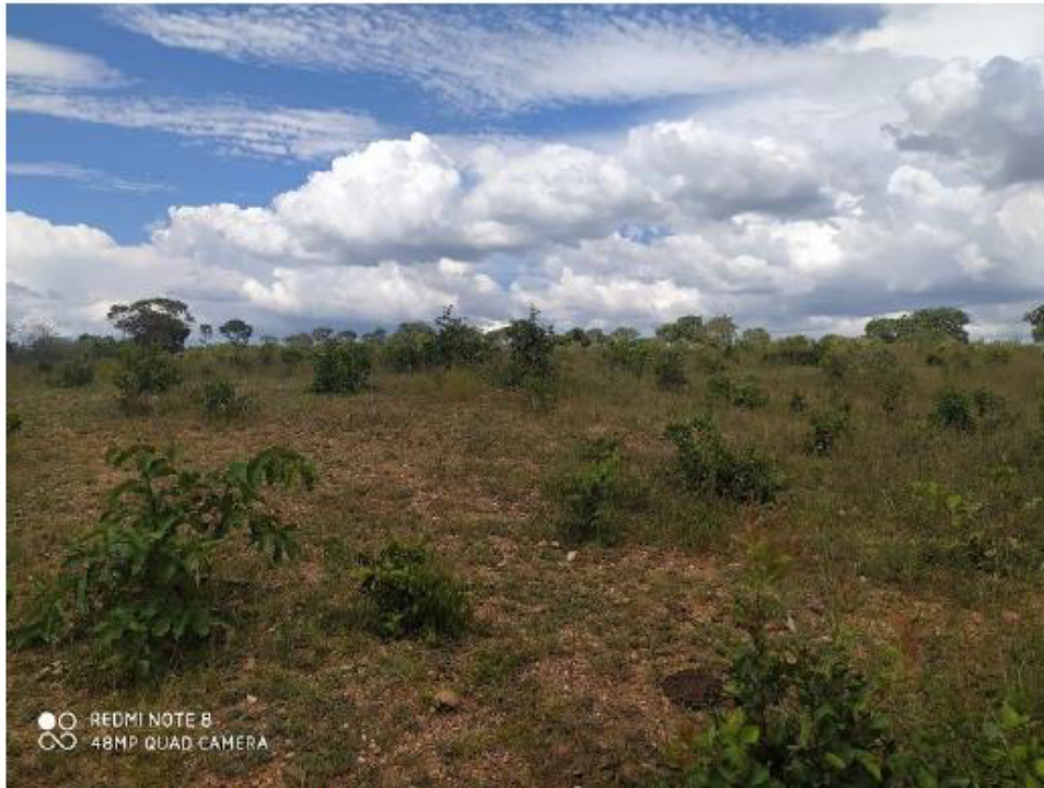
Figura 1. Área de influência direta pleiteada para intervenção, município de Corinto, Minas Gerais.