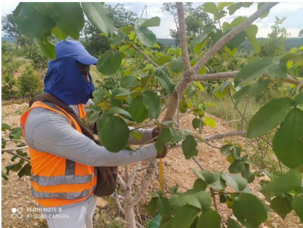
Figura 6. Mensuração de indivíduo de Pequi ( Caryocar brasiliense ) na área em estudo (559948.31 m E/ 7973326.75 m S), porém, esse indivíduo não apresentou critério de inclusão com DAP \leq 15,7 cm de circunferência a altura do peito.

O Empreendedor entende que não se pode supor a respeito da não preservação das árvores ou que o empreendimento venha afetar as raízes delas, sem argumentação real, o qual o empreendedor entende que seu compromisso de preservação das árvores é colocado em dúvida sem motivos antes do início do empreendimento.