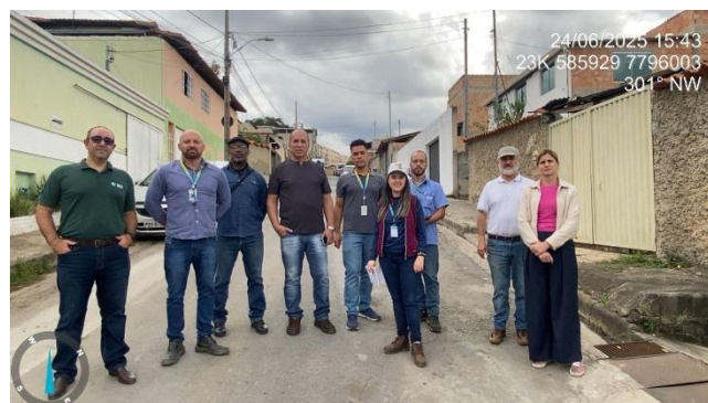
Figura 5 - Equipe presente na visita técnica