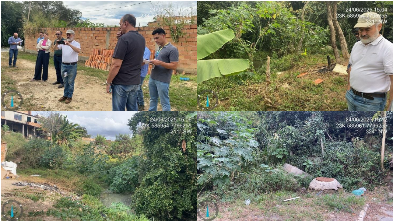
Figura 3 – Visita ao Trecho 1 (Processo nº 45419/2024)