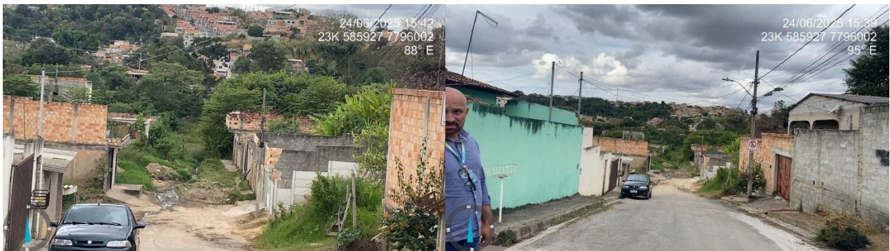
Figura 4 - Visita ao Trecho 3 (Processo nº 45750/2024)