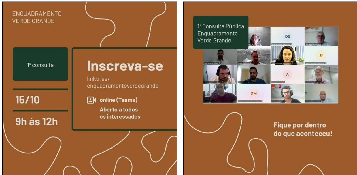
Foto 03: Registro da 1ª Consulta Pública, virtual, do CBHVG sobre o Enquadramento na Bacia Hidrográfica do rio Verde Grande, em 15 de outubro de 2024.