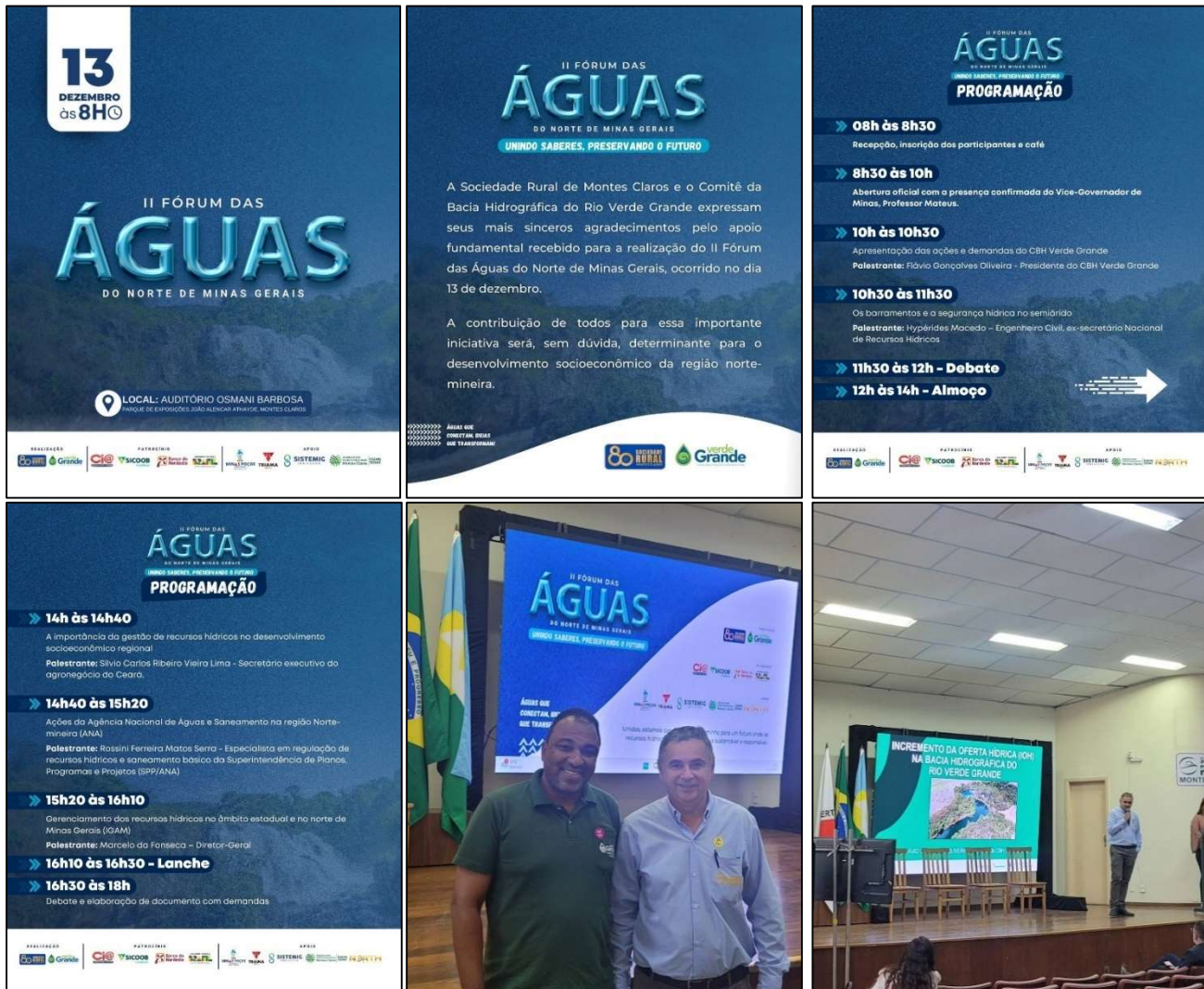
Foto 01: Registro do II Fórum das Águas, realizado em dia 13 de dezembro de 2024, na cidade de Montes Claros/MG.