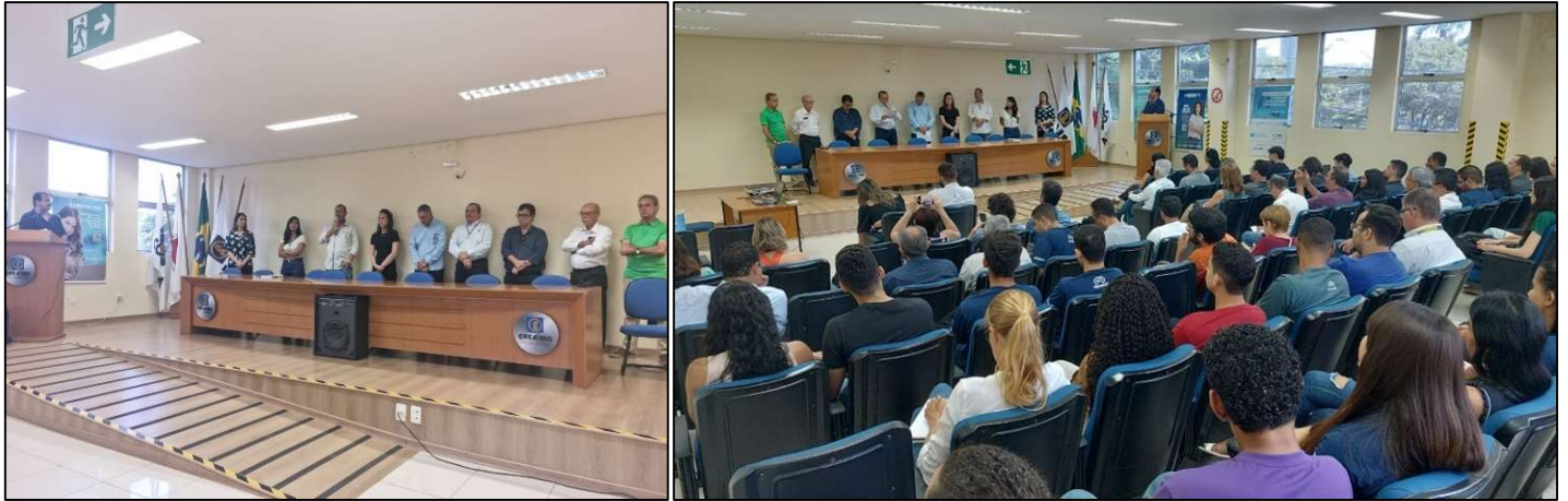
Foto 02: Registro do evento Encontro das Águas, em comemoração ao Mês das Águas, ocorrido em .