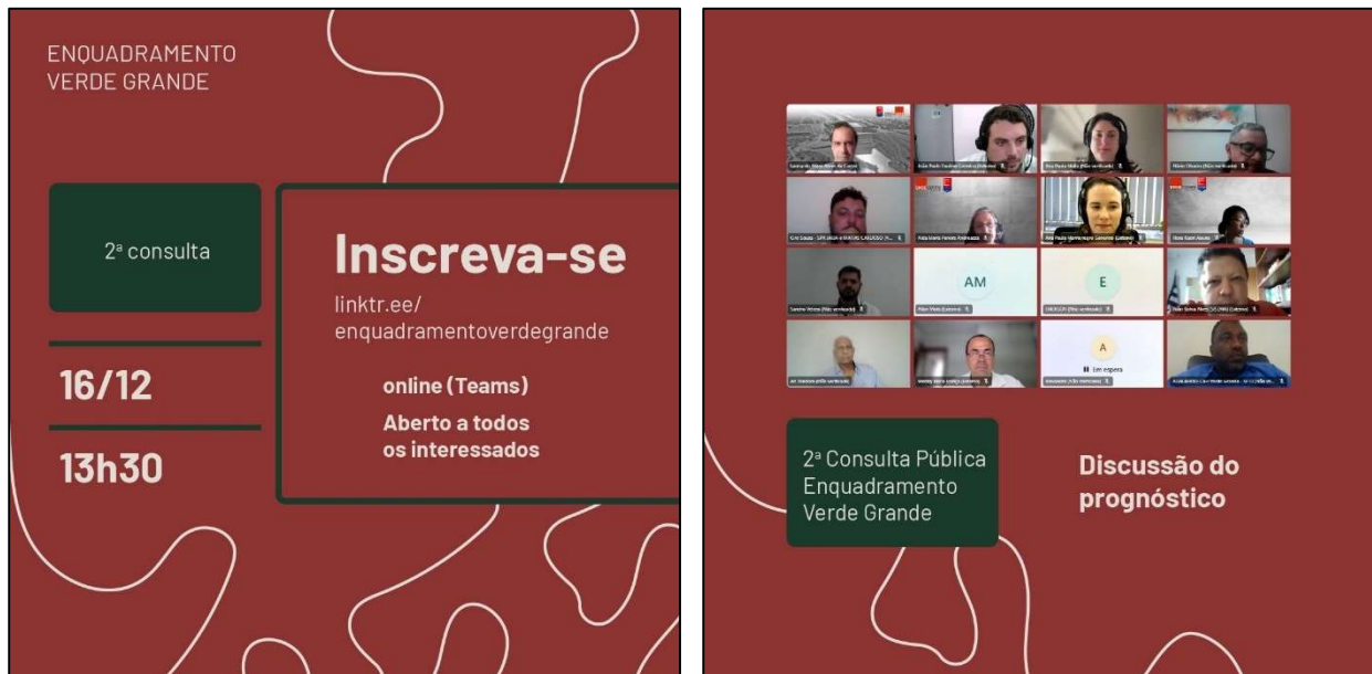
Foto 04: Registro da 2ª Consulta Pública, virtual, do CBHVG sobre o Enquadramento na Bacia Hidrográfica do rio Verde Grande, em 16 de dezembro de 2024.