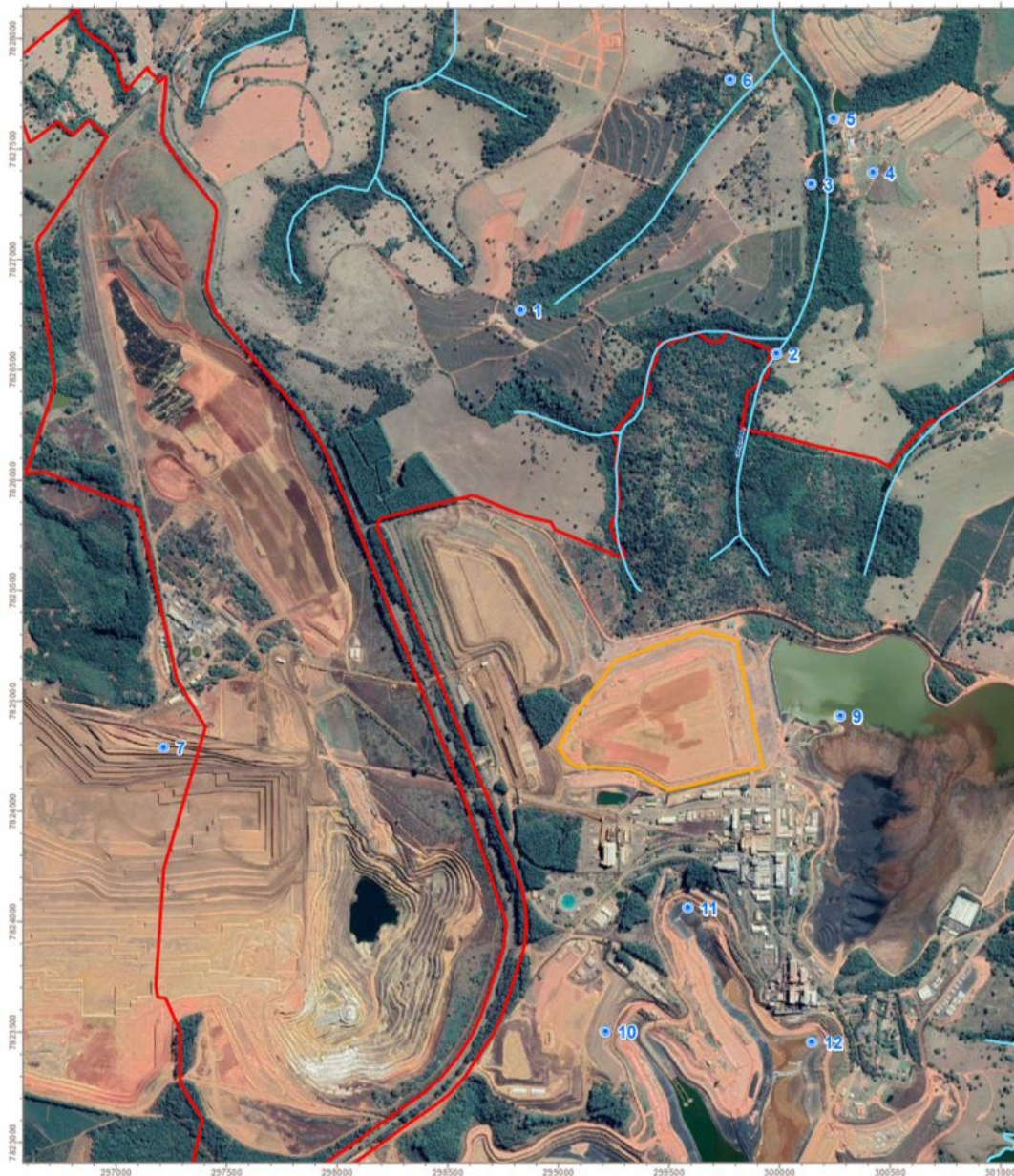
Figura 1. Localização das captações.

Conforme consta no parecer de outorga elaborado pelo IGAM e com base na consulta dos pontos que possuem Outorga de Direito de Uso de Recursos Hídricos no IGAM (Instituto Mineiro de Gestão de Águas), através do acesso à plataforma IDE-Sisema, realizado em 24 de setembro de 2021. Foram verificados 04 pontos que possuem outorga para água superficial e 03 pontos para água subterrânea vigentes, referentes a terceiros em um raio de 2,5 km do poço PAP-08, conforme imagem abaixo.