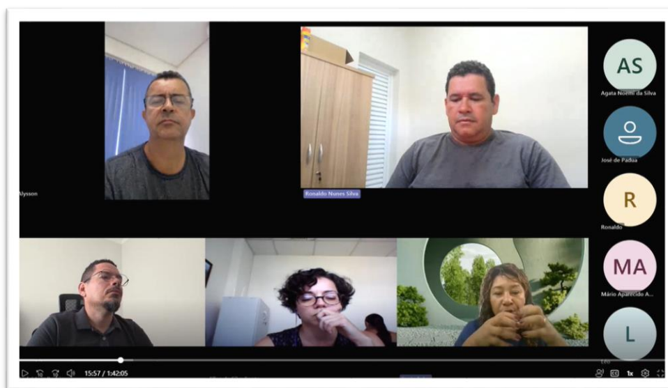
Figura 3 Registro fotográfico da 1ª Reunião de Trabalho CTIG do CBH GD7 – 02-10-2025