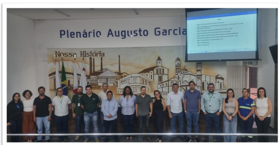
Figura 2 Registro fotográfico da 2ª Reunião Ordinária do CBH GD7 - 04/12/2025