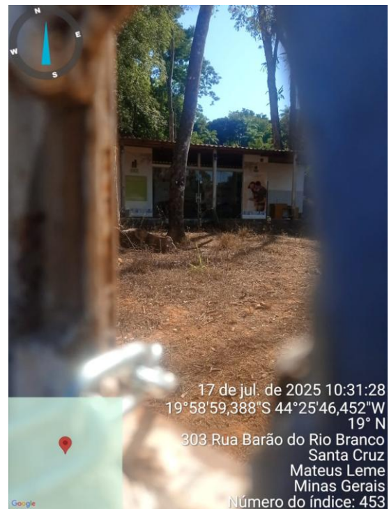
Imagens 1 e 2: Evidenciando o portão de entrada do condomínio.