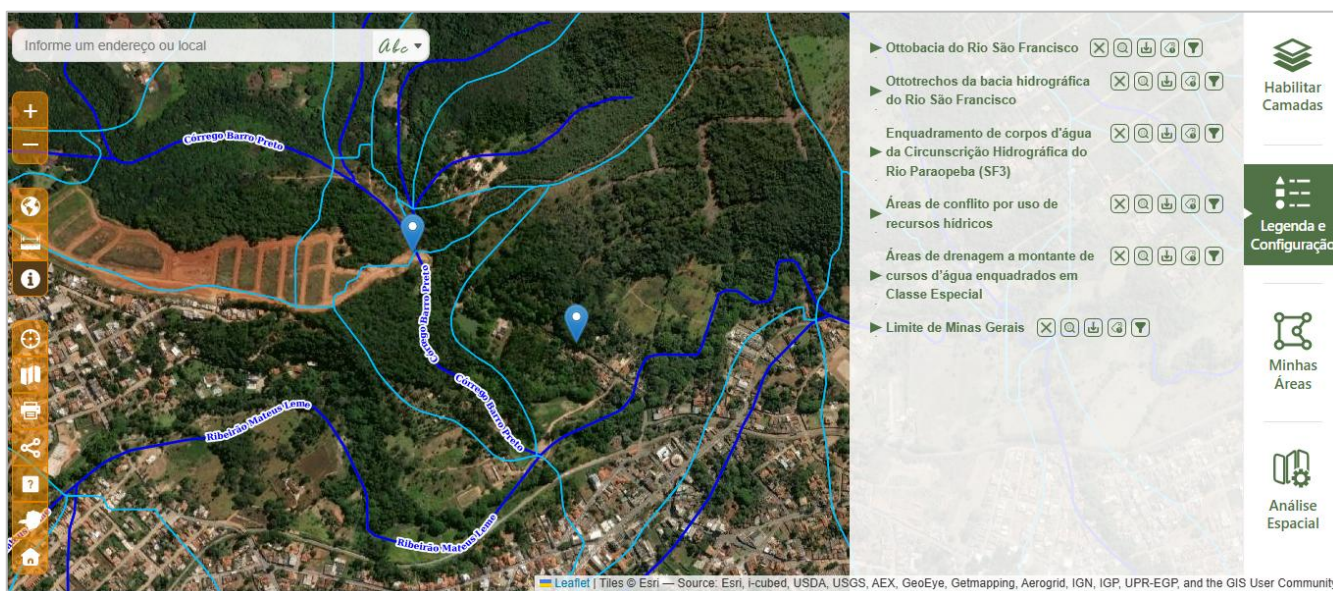
Imagem 15: hidrografia da área.

Para subsidiar a análise quanto à presença de curso d'água no local da denúncia, foi realizada consulta posterior à plataforma IDE-SISEMA. A imagem extraída dessa base encontra-se a seguir como elemento de apoio visual.