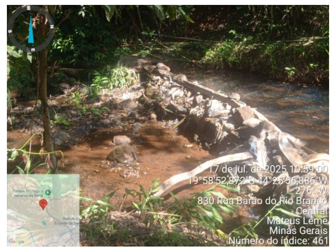
Imagens 9 a 14: Registro do trecho do rio evidenciando a canalização, a ponte sobre seu leito e a sinalização da área de preservação permanente.