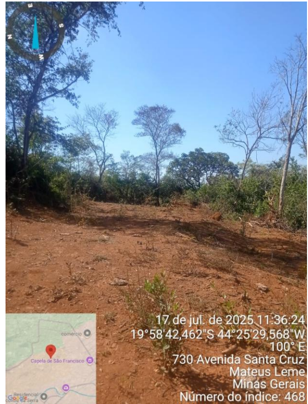
Imagens 3 a 8: Registro do Percurso Realizado: Acessos, Vias Locais e Áreas com Intervenção sobre a Vegetação.

Durante o percurso, foi identificada, em uma das vias próximas, a existência de uma ponte com canalização de trecho do curso do rio - ao que parece, denominado Córrego Barro Petro - o que pode indicar intervenção hídrica na área, demandando verificação quanto à regularidade e licenciamento da obra.