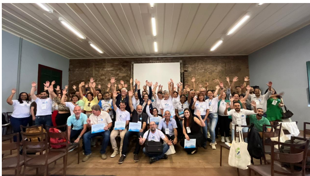
Participantes do 8º Encontro de Integração da Bacia do Rio Doce – abril de 2024

No evento foi abordado o processo de revisão do Plano de Recursos Hídricos, o desenvolvimento dos programas de Educação Ambiental e Comunicação para a bacia, o Sistema de Gerenciamento de Recursos Hídricos, bem como outros temas relevantes relacionados à gestão hídrica.