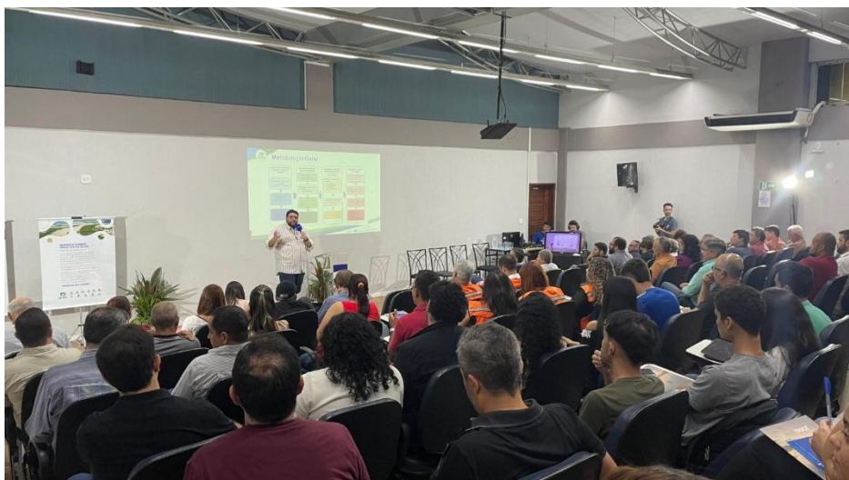
Lançamento do Sistema de Previsão de Cheias – agosto de 2024