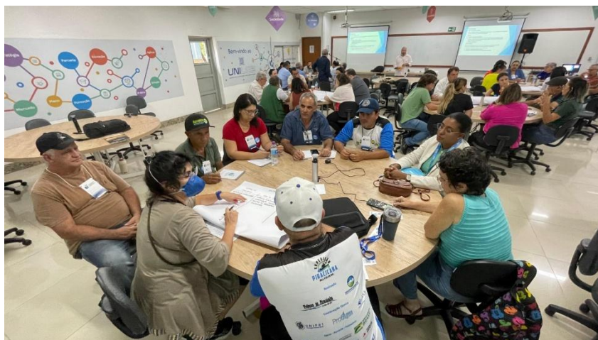
1ª Oficina Integrada de Educação Ambiental – outubro de 2024

O evento teve como objetivo apresentar as ações já desenvolvidas na bacia e definir estratégias para e construir diretrizes para fortalecimento e integração das iniciativas já existentes. A oficina atende às metas de planejamento da Câmara Técnica de Capacitação, Comunicação e Educação Ambiental (CTCEA).