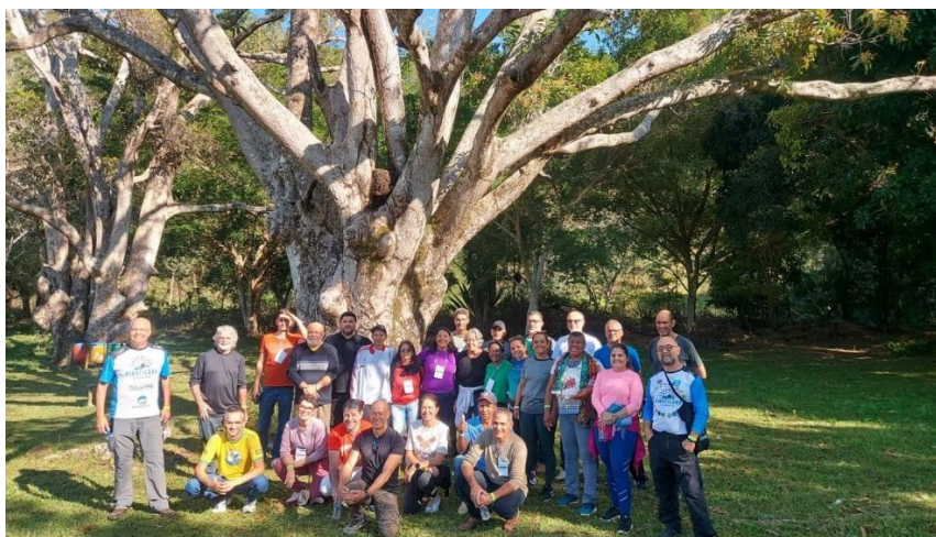
2º Encontro da Sociedade Civil – 22/08/2024

Durante todos os dias de encontro, os membros da Sociedade Civil organizada realizaram debates, participaram de palestras, painéis de demonstração de resultados e tomaram decisões importantes pensadas para a necessidade de fortalecimento de vínculos e melhor organização do segmento, no sentido de atuar de maneira unificada para solução dos problemas comuns à rotina dos Comitês de Bacias Hidrográficas.