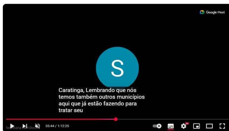
Reunião CBH-Caratinga - 28/11/2024