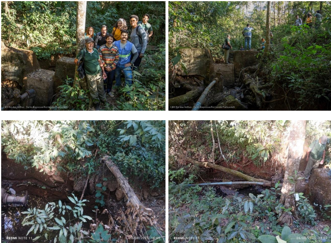
Figura 2 - Área da intervenção

O ponto de captação (Figura 2) é constituído por uma estrutura de concreto do tipo barramento, implantada no leito do curso d'água, dotada de tubulação destinada à derivação da água. Verifica-se, ainda, que a área de entorno se encontra recoberta por vegetação nativa em bom estado de conservação.