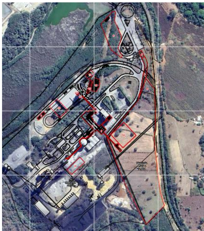
Figura 1 - Áreas previstas para ampliação (polígonos em vermelho)

Em 22-6-2023, o empreendedor formalizou o processo SLA 1321/2023 solicitando a ampliação da sua capacidade nominal de fabricação de cimento de 600.000 t/ano para 1.500.000 t/ano, sendo assim a capacidade pleiteada e avaliada neste parecer é de 900.000 t/ano. De acordo com a DN 217/2017, a ampliação do empreendimento enquadra-se como classe 5, sob o código B-01-05-8. Esta ampliação é prevista com a instalação de uma nova unidade de moagem de cimento, ampliação do galpão de peletizado, modernização de big bag, nova ensacadeira e paletizadora, novo sistema de carregamento a granel, implantação de galpão de armazenamento de depósito de aditivos e ampliação de pátios, novas balanças rodoviárias e ampliação do estacionamento de caminhões. Todas essas estruturas dentro da planta de operação já existente.