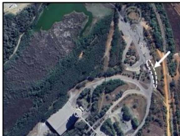
Figura 3 – Área prevista para instalação do novo acesso e novas balanças