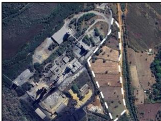
Figura 5 - Área prevista para instalação do novo pátio de insumos e galpão de aditivos