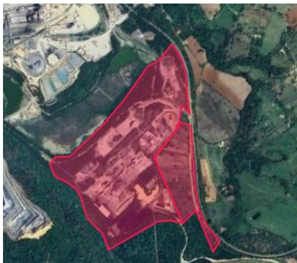
Figura 2 – ADA do empreendimento juntamente à área a ser ampliada

A área total do empreendimento possui 55,3 ha, sendo 28350 m 2 de área construída. Com a ampliação passará a ser 88846 m 2 de área construída, conforme mostram as figuras abaixo: