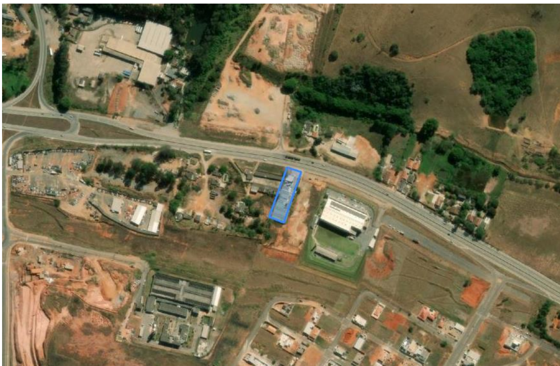
Figura 1: Imagem de satélite do empreendimento e seu entorno

Em 23/03/2023, formalizou na Supram SM, o processo administrativo de Licenciamento Ambiental Simplificado (LAS) de n. 622/2023 , via Relatório Ambiental Simplificado (RAS), com a incidência de critério locacional 1, por se localizar em zona de amortecimento de Unidade de Conservação definida por raio de 3km (Parque Municipal de Pouso Alegre, UC de proteção integral, conforme Lei 3.411 de 13/03/1998) e na zona de transição da Reserva da Biosfera da Mata Atlântica. A consulta quanto à localização é feita na plataforma IDE SISEMA, disponível em https://idesisema.meioambiente.mg.gov.br/webgis .