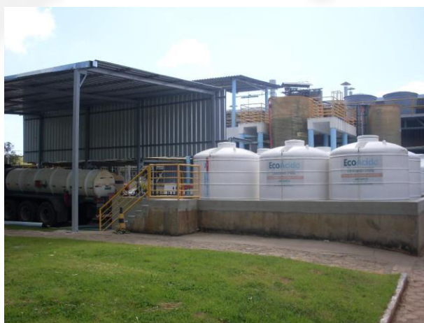
Foto 01. Vista geral do empreendimento.