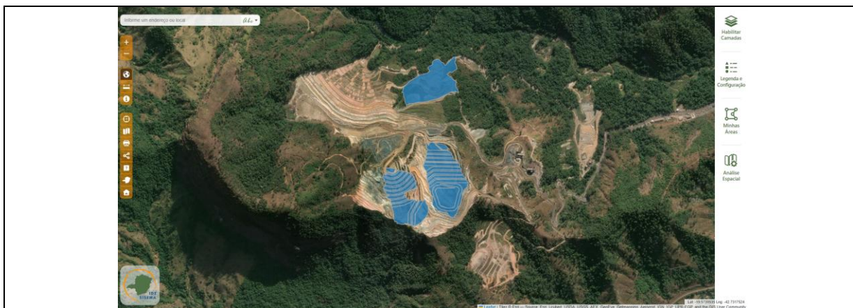
Figura 01: Imagem da plataforma IDE da área do empreendimento.

ampliação" na etapa "Parâmetros da atividade", no SLA. Há, ainda, campo separado "Quantidade já licenciada" para a inserção dos valores dos parâmetros já licenciados, incluso no total considerado do campo anterior. O que foi realizado devidamente pelo empreendedor.