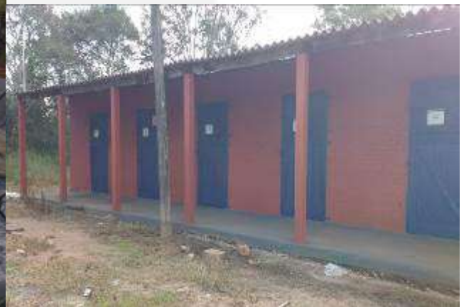
Foto 04. Depósito Temporário de Resíduos Sólidos