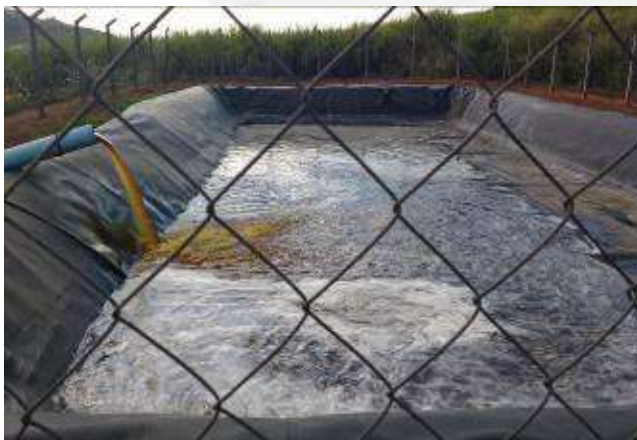
Foto 03. Lagoa de armazenamento de Efluente Industrial