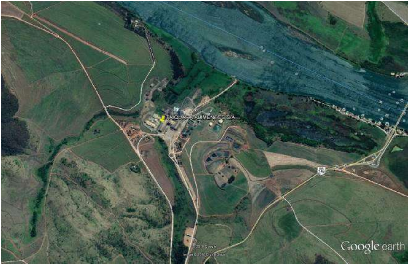
FIGURA 01 - Imagem de satélite do local onde a ITAIQUARA ALIMENTOS S/A está instalada

As Áreas de Preservação Permanente – APP's das três propriedades supracitadas somam-se 785,00 ha e encontram-se parcialmente vegetadas, sendo que a ITAIQUARA ALIMENTOS S/A apresentou preteritamente Projeto Técnico de Reconstituição de Flora – PTRF, visando a recuperação/recomposição dessas áreas.