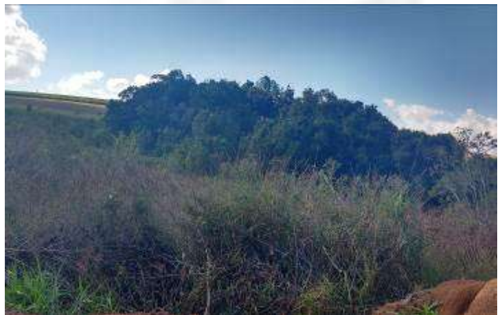
Foto 02. Uma das áreas de Reserva Legal