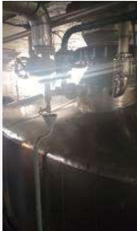
Foto 01. Produção de Fermento