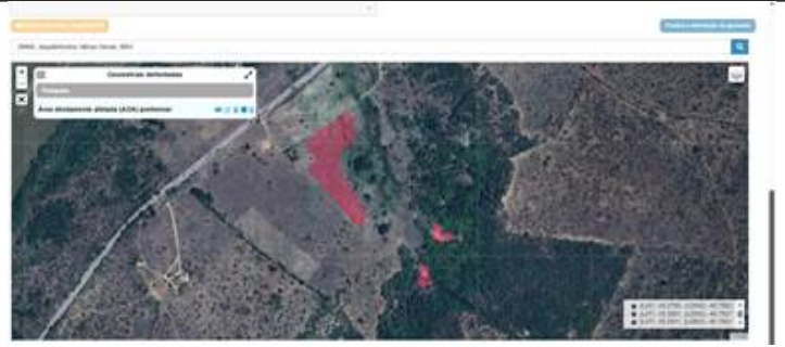
Figura 2. Área Diretamente Afetada protocolada na formalização do processo de licenciamento disponível no SLA.

IC nº 2: No entorno das coordenadas 16°16'48.21"S/ 40°45'57.66"O; 16°16'49.68"S/ 40°45'57.73"O; 16°16'50.85"S/ 40°45'58.30"O, indicado como estrada há vegetação nativa. Apresentar ato autorizativo para supressão ou projeto alternativo que não demande supressão de vegetação.