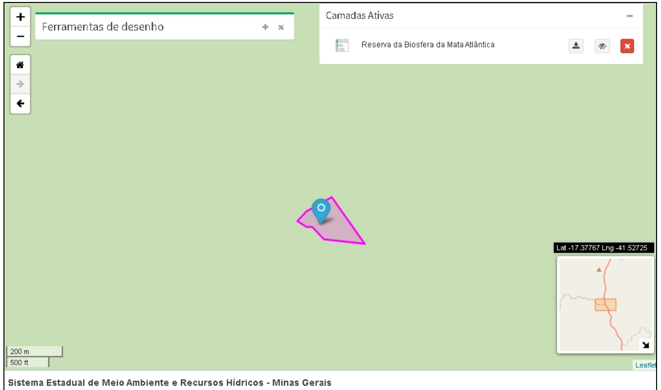
Figura 02: Imagem da área do empreendimento constando a localização na Reserva da Biosfera da Mata Atlântica.

empreendimento. Esta viabilidade foi aferida por meio da avaliação dos impactos do empreendimento no critério locacional em questão, o que repercutiu no estabelecimento das medidas de controle, presentes no estudo em referência, julgadas adequadas neste parecer.