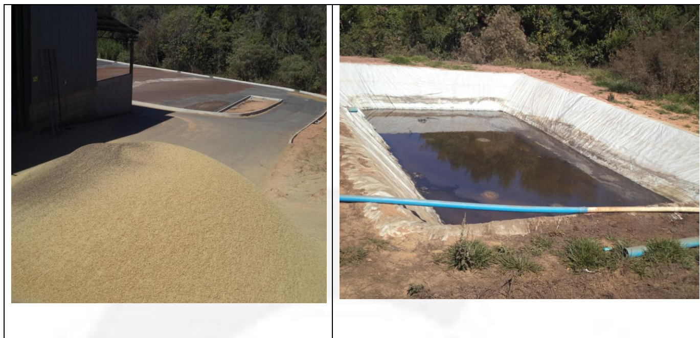
Figura 03- Lagoa que recebe os efluentes provenientes da lavagem e despolpa do café

Esses efluentes possuem uma alta carga orgânica com valores que variam de 1837 mg L -1 a 3.242 mg L -1 e um teor de potássio de aproximadamente 320 mg L -1 . Esses efluentes é gerado quanto ocorre a atividade de lavagem e despolpa do café, sendo utilizado como fertilizante na própria lavoura de café juntamente com a casca de café e resíduos do sistema de compostagem.