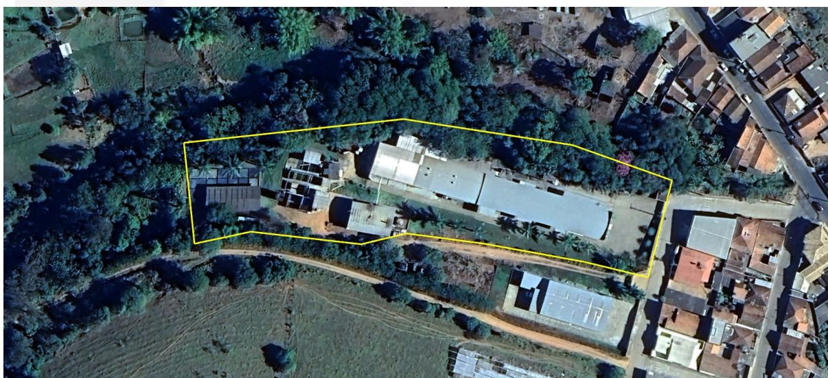
Figura 1 - Localização do empreendimento

O empreendimento está instalado em um terreno de 15.000 m 2 , tendo 2.632 m 2 de área construída e 6.925 m 2 de área útil, conforme os limites da ADA apresentados no SLA e reproduzidos na figura a seguir.