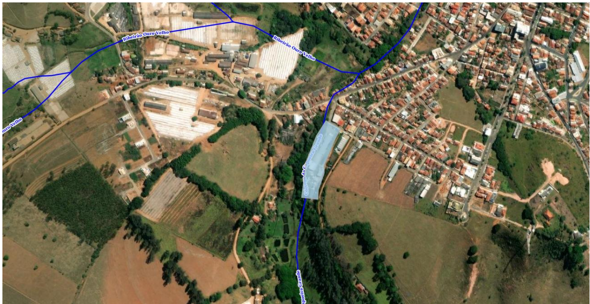
Figura 3 - Hidrografia na área do empreendimento

Na ADA não consta a existência de recursos hídricos, havendo apenas o curso d'água adjacente.