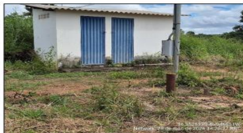
Poço de captação de água