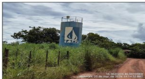
Reservatório de água