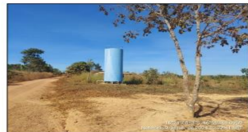
Reservatório de água