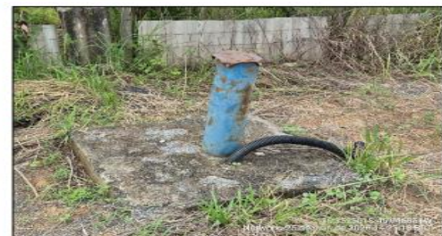
Poço de captação de água