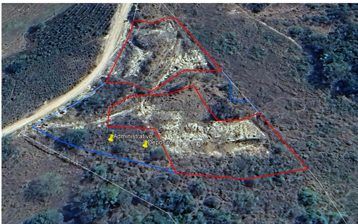
Figura 03: Imagem de satélite da ADA (azul), área de lavra (vermelho) e do local onde serão construído o depósito e o administrativo .

Foi verificado por imagem de satélite que na área útil do empreendimento onde serão construídas as estruturas como o depósito e o administrativo existem árvores isoladas, as quais serão suprimidas, necessitando dessa forma de autorização conforme o Decreto 47.749 de 2019.