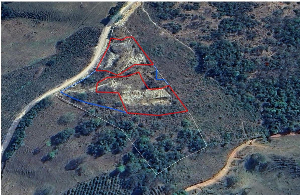
Figura 01: Imagem de satélite da ADA (azul) e área de lavra (vermelho) do empreendimento e seu entorno.

A Figura 01 mostra a localização do empreendimento.