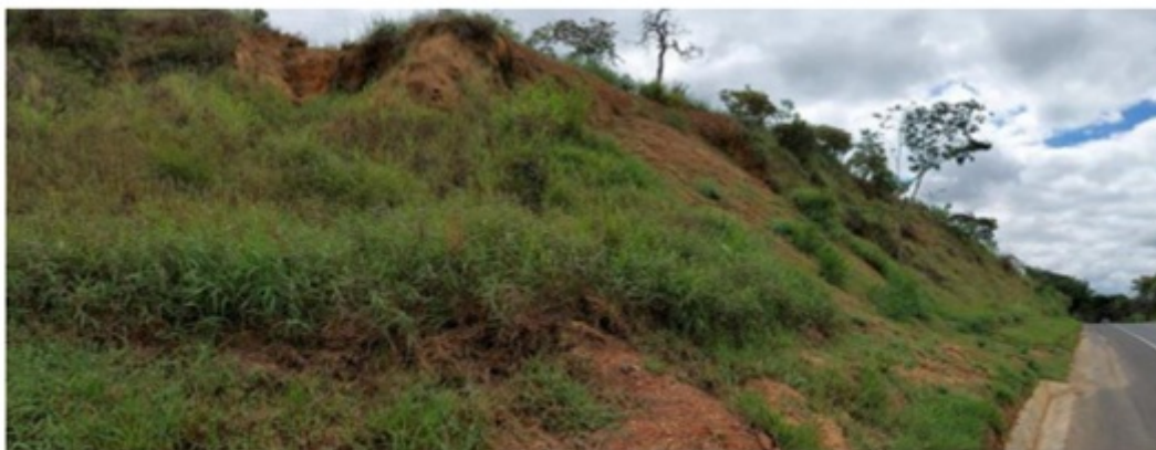
Figura 1 – Vista da área a ser licenciada, evidenciando a geometria do talude.

Foi apresentado documentos que comprovam o caráter emergencial da intervenção requerida: documentos SEI n. 118257602 e 111921926.