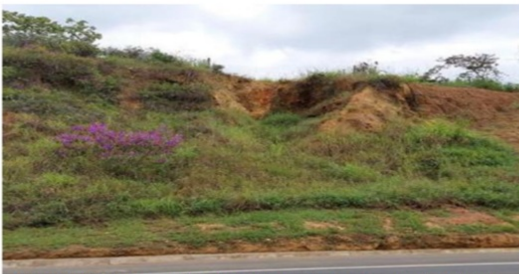
Figura 2 – Vista da área a ser licenciada, evidenciando os processos erosivos existentes.

Figura 2: fotos apresentadas no processo com detalhe da localização dos indivíduos arbóreos suprimidos.