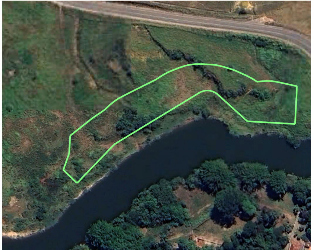
Ilustração da poligonal de compensação proposta pelo empreendedor:

Poligonal proposta para execução do PRADA, anexado no processo em SHP, deverá iniciar a execu