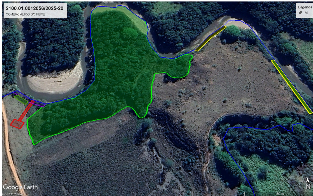
Imagem 2 - Área de Intervenção Ambiental (vermelho), Compensação (azul claro), Recomposição de APP obrigatória (roxo), Reserva Legal (verde) e outras áreas de Recomposição de APP obrigatória (amarelo).