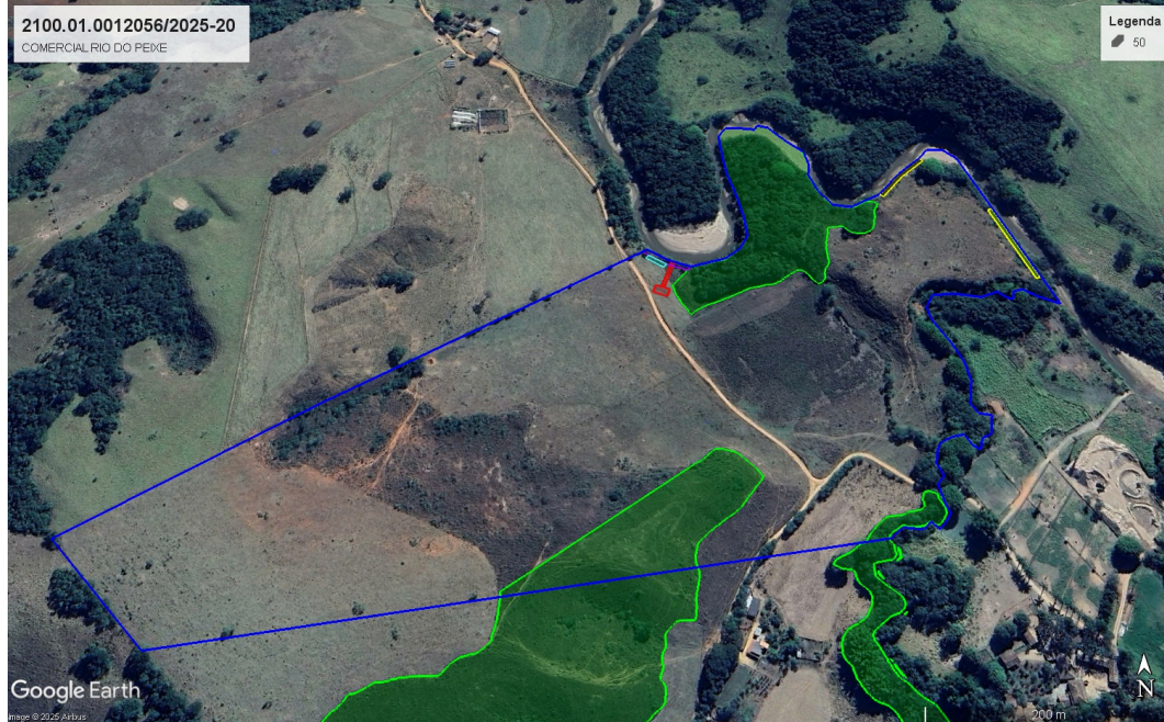
Imagem 3 - Área de do imóvel RIBEIRÃO (azul) e áreas de Reserva Legal (verde) que foi declarada em conjunto com o imóvel CHACRINHA circunvizinho e do mesmos proprietários.