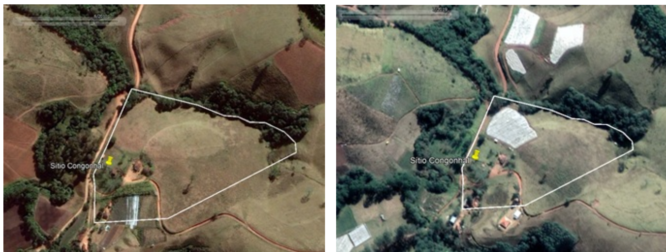
FIGURA 02: Imagens de satélite ano base 2010 e 2019

Taxa de Expediente: R$629,61 - Pgto 10/10/2023