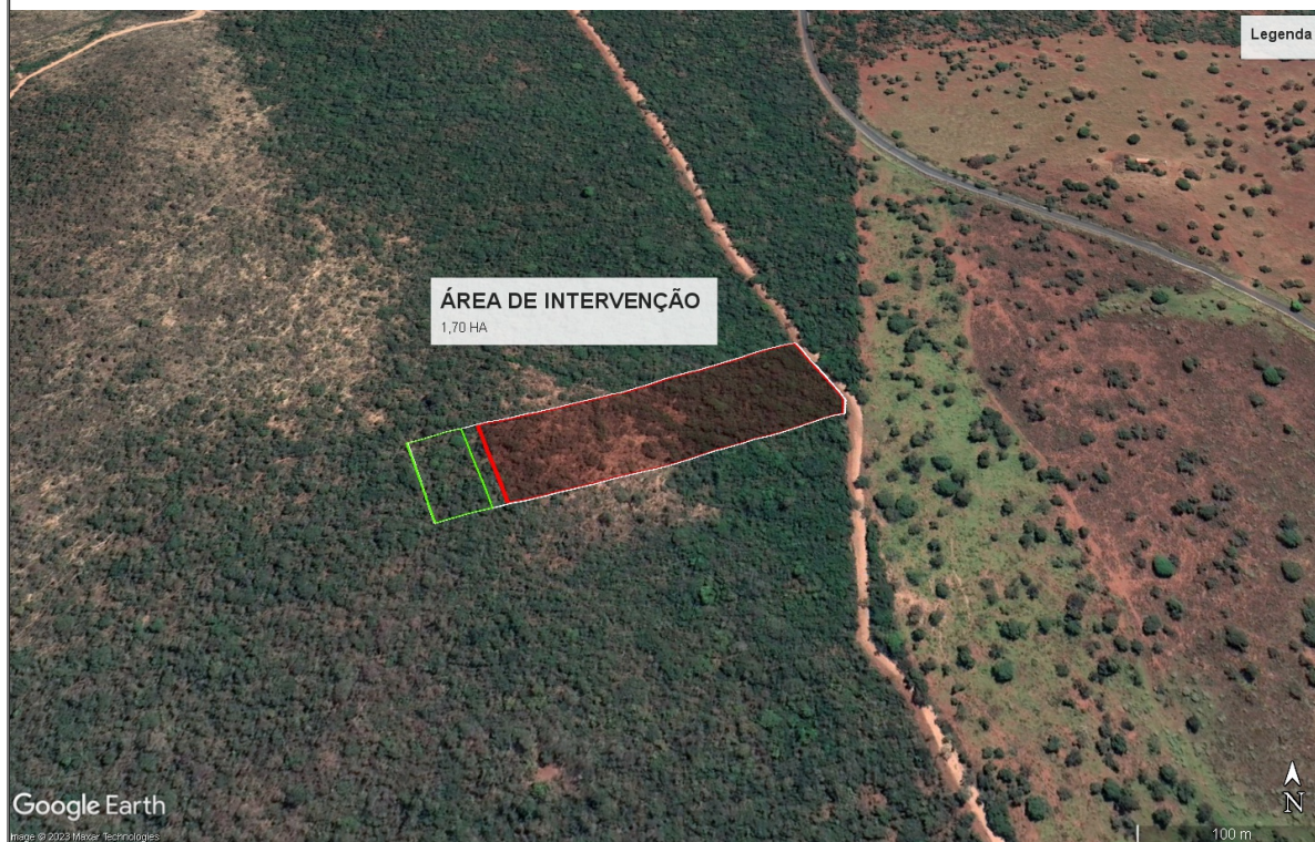
Figura 3- Polígono vermelho, área de intervenção. Polígono branco, limite da propriedade. Polígono verde, reserva legal.

Número do recibo do projeto cadastrado no Sinaflor: 23126627.