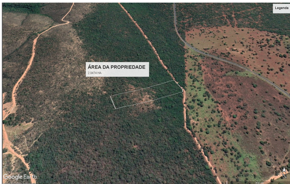
Figura 1-Polígono branco, limite da propriedade