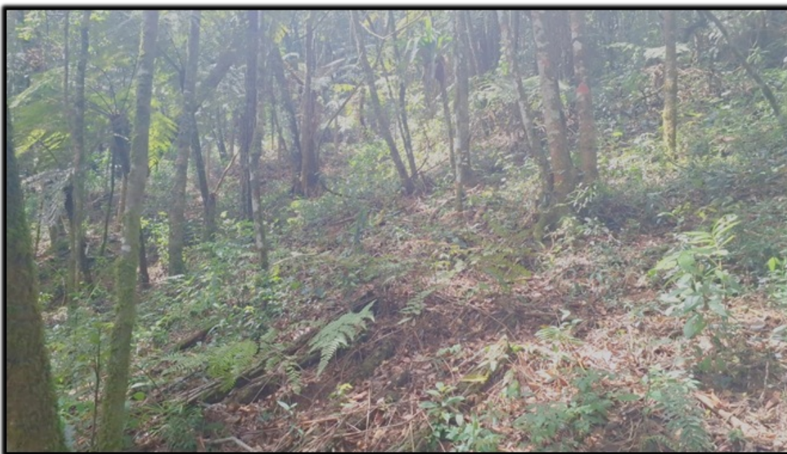
Imagem 5 - Vista da área de compensação no interior do lote para espécie ameaçada