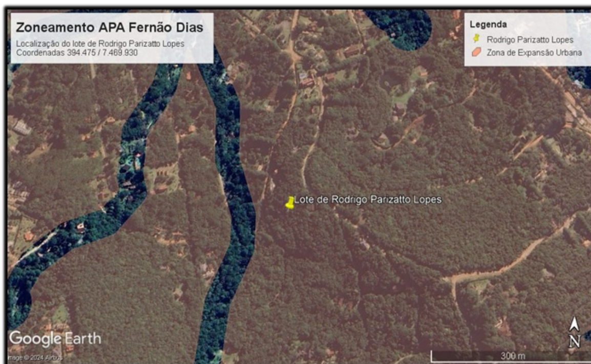
Imagem 7 - localizado na Zona de Expansão Urbana segundo o Zoneamento Ambiental da APA Fernão Dias