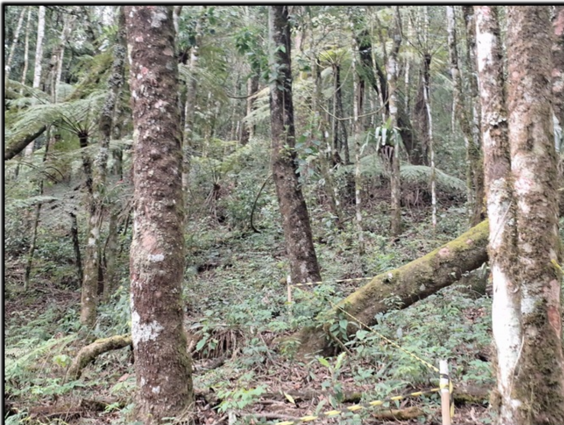
Imagem 4 - Vista da área de compensação no interior do lote