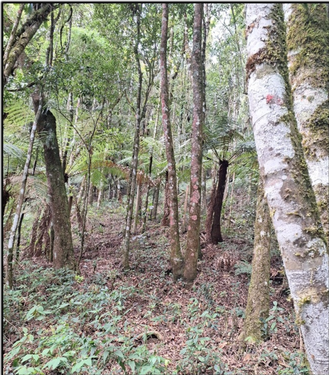
Imagem 2 - Vista do interior do lote