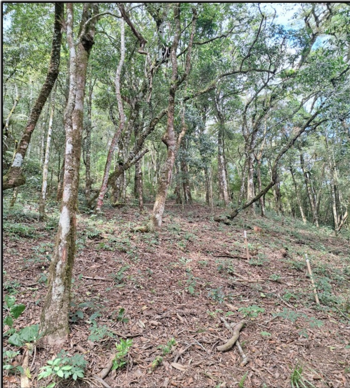
Imagem 3 - Vista do interior do lote com demarcação da área da intervenção