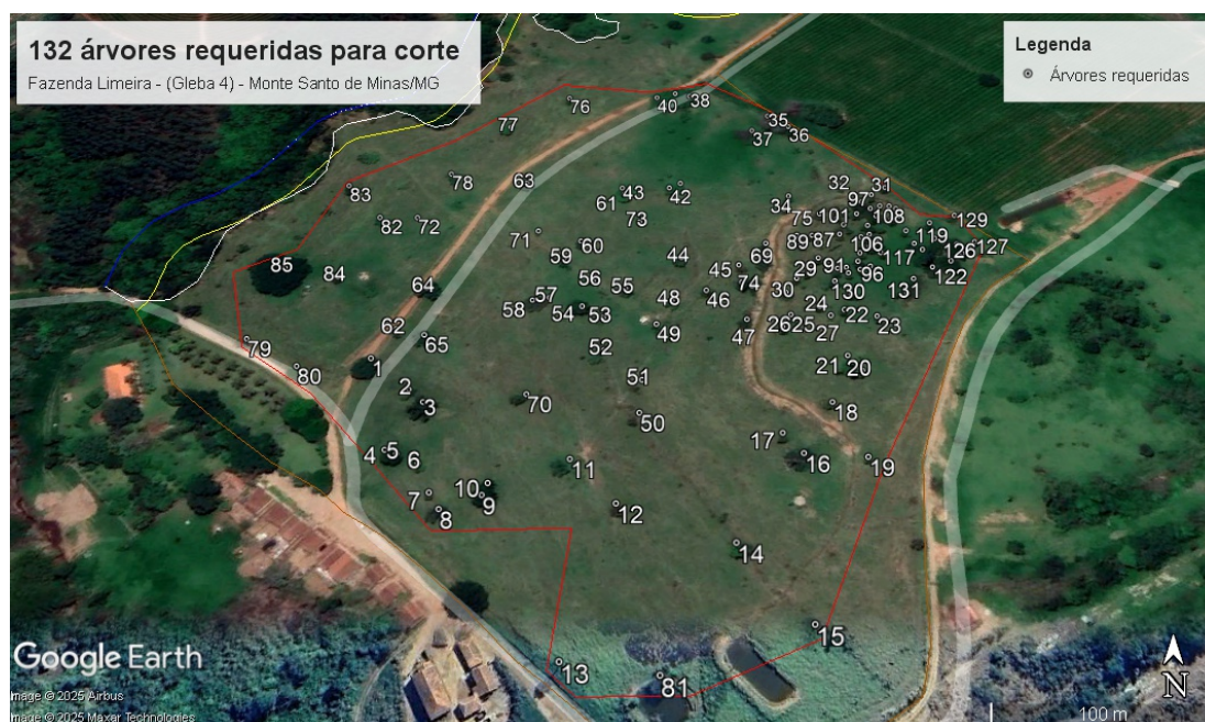
Figura 1- Destaque para as árvores isoladas nativas vivas (representadas pelos círculos numerados) requeridas para corte em área de 11,32 hectares na Fazenda Limeira - (Gleba 4), município de Monte Santo de Minas/MG (Fonte: Imagem obtida a partir dos arquivos digitais fornecidos pela responsável técnica pelo Processo SEI Nº 2100.01.0014143/2025-28).