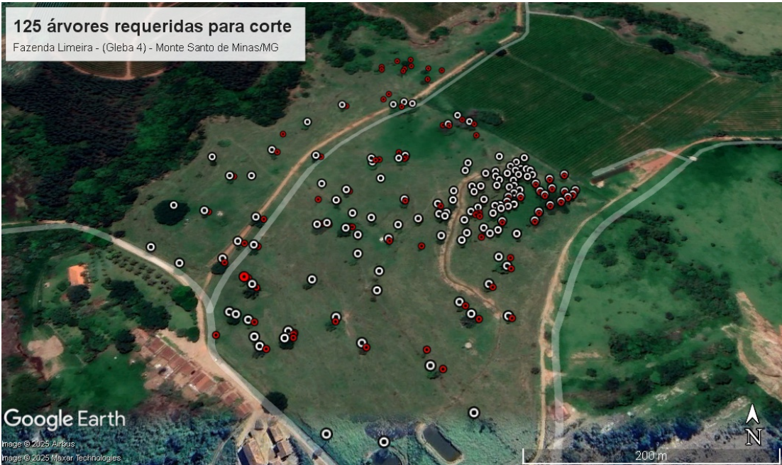
Figura 3- Localização comparada de cada indivíduo solicitado para corte na Fazenda Limeira - (Gleba 4), em Monte Santo de Minas/MG (ícones vermelhos representam árvores com localizações corrigidas e ícones brancos referem-se ao pedido inicial). Fonte: arquivos digitais (anterior e novo) fornecidos pela consultora ambiental no Processo SEI Nº 2100.01.0014143/2025-28.

Em análise da nova planta planialtimétrica (119304161), constam alterações nas localizações de grande parte das árvores solicitadas para corte, conforme imagem comparativa incluindo os dados do requerimento inicial (vide Figura 3, abaixo).