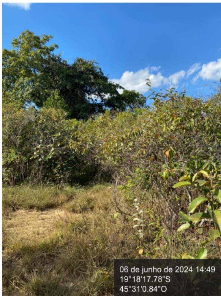
Figura 5. Árvore isolada ao fundo, estrato herbáceo e gramínea exótica recobrindo o solo.