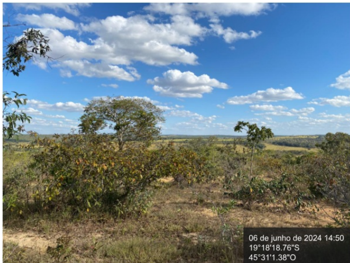
Figura 3. Árvore isolada ao fundo, herbáceas sem rendimento lenhoso e solo recoberto por gramínea exótica.