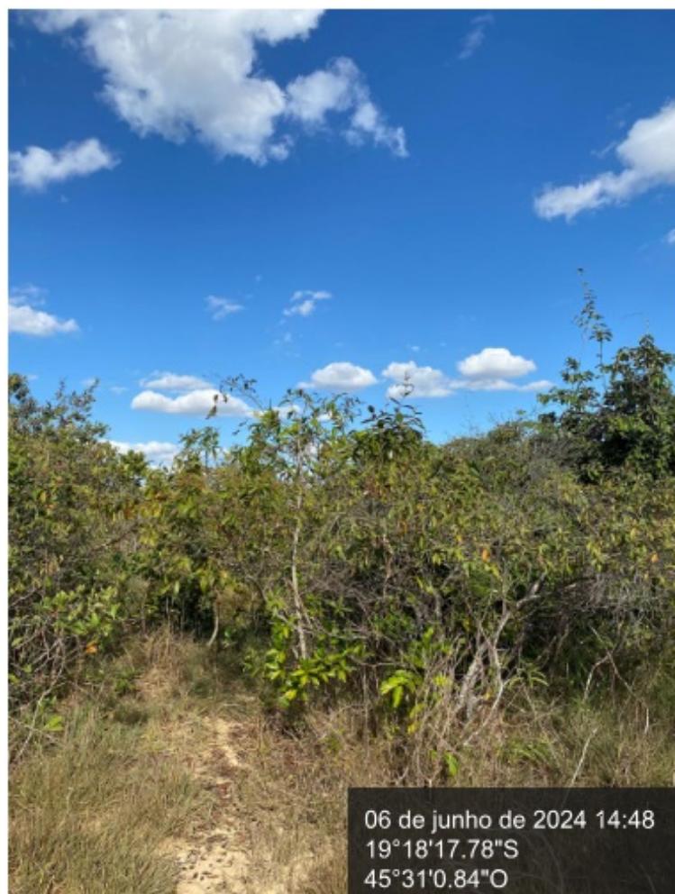
Figura 4. Indivíduos herbáceos sem rendimento lenhoso e gramínea exótica recobrindo o solo.