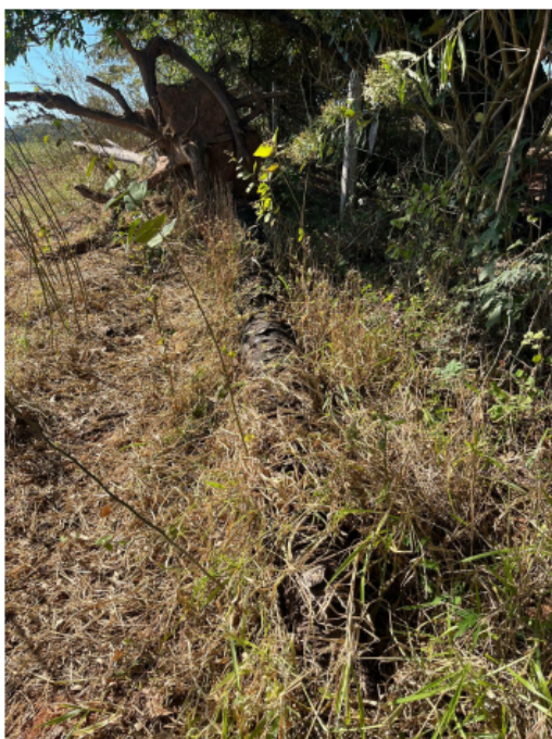
Coco Baboso seco, coordenada 352216,77 m E, 7707299,29 m S

Conforme planta apresentada, as marcações em rosa (ponto) refere-se a árvores e coco baboso secas e em verde coco baboso que foram derrubados pelo vento. Foi apresentado relatório fotográfico das árvores mortas e derrubadas pelo vento (documento n. 69950861 ). Abaixo segue exemplo.