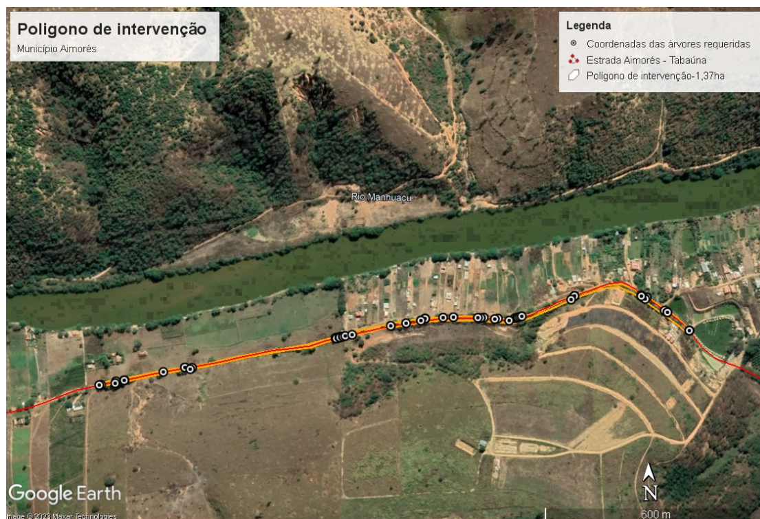
Figura 2 - Área de todas as árvores requeridas o corte (Circunscrito em laranja).

Taxa de Expediente: DAE nº 1401281694185, valor 679,98, paga conforme DAE online.