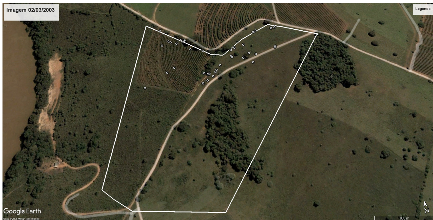
Imagem 01

disponíveis e foi assim constatado que não houve atividades antrópicas ilegais no período de 02/03/2003 e 15/06/2024 conforme imagens históricas do Google Earth nas referidas datas e constatado ainda através do Mapbiomas se tratar de área antropizada conforme figura abaixo.