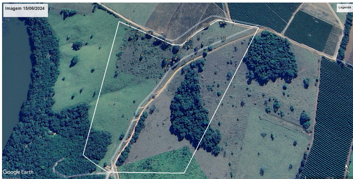
Imagem 02