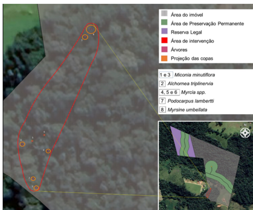
FIGURA 02: Levantamento planimétrico cadastral do sítio Matos de Minas, Bairro Sertão do Canta Galo, município de Gonçalves /MG.

Em análise remota mediante a utilização de recursos tecnológicos disponíveis, em especial, Google Earth, IDE-Sisema e Trackmaker, foi verificado que as árvores requeridas para supressão estão distribuídas num remanescente de vegetação nativa que ultrapassa 0,2 hectare, cujas copas estejam em contato entre si, agrupadas e contíguas, portanto, não se enquadrando como árvores isoladas segundo o disposto do inciso IV do art. 2º do Decreto 47.749/2019 .