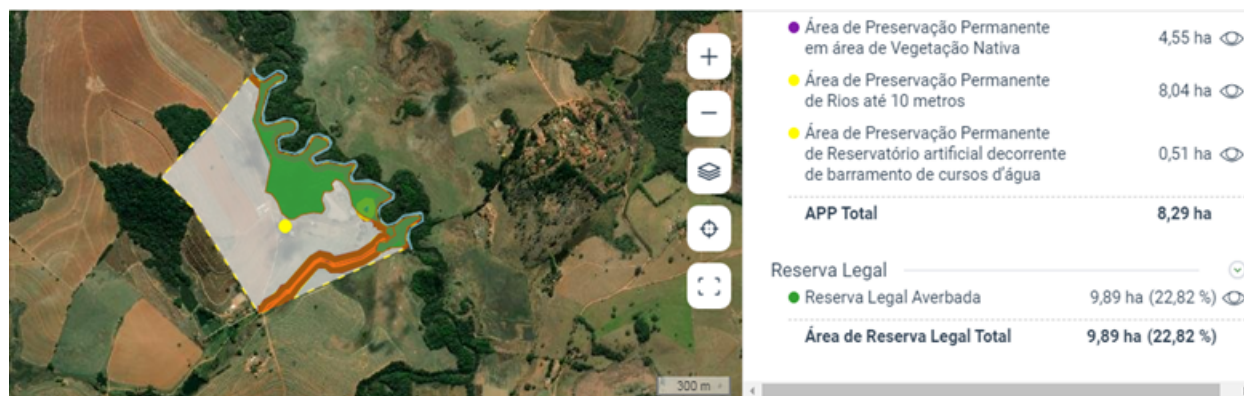
Imagem extraída do SICAR comprovando a intervenção fora das áreas de preservação permanente e Reserva Legal