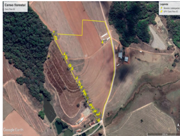
Imagem 1 - Planta topográfica Sítio Recanto do Jacarandá