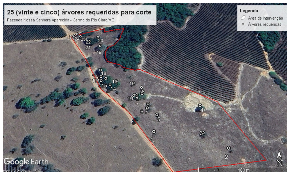
Figura 1- Destaque para a localização das 25 (vinte e cinco) árvores isoladas nativas vivas requeridas para corte (representadas pelos círculos numerados) em área de 2 (dois) hectares (representada em ) na Fazenda Nossa Senhora Aparecida, município de Carmo do Rio Claro/MG (Fonte: arquivos digitais fornecidos pela responsável técnica do referido projeto).

Em atendimento ao ofício supracitado, a engenheira apresentou o relatório técnico fotográfico (113330139) e croqui (113330140) que demonstram a localização de cada árvore requerida, conforme numeração (vide Figura 1 extraída dos novos arquivos).