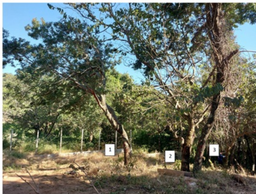
FIGURA 03: Imagem das árvores isoladas nativas na propriedade Gleba Rural 6, bairro Nossa Senhora de Fátima, município de Itajubá/MG, solicitadas para corte ou aproveitamento.