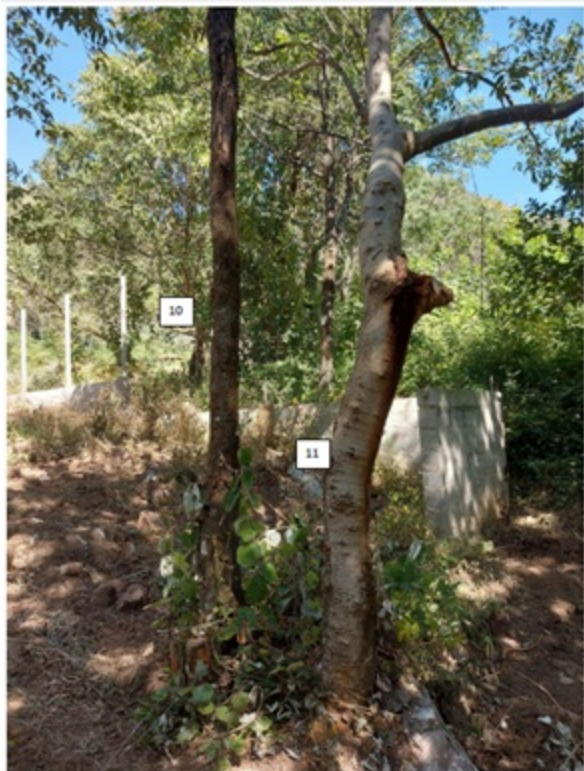
FIGURA 06: Imagem das árvores isoladas nativas na propriedade Gleba Rural 6, bairro Nossa Senhora de Fátima, município de Itajubá/MG, solicitadas para corte ou aproveitamento.