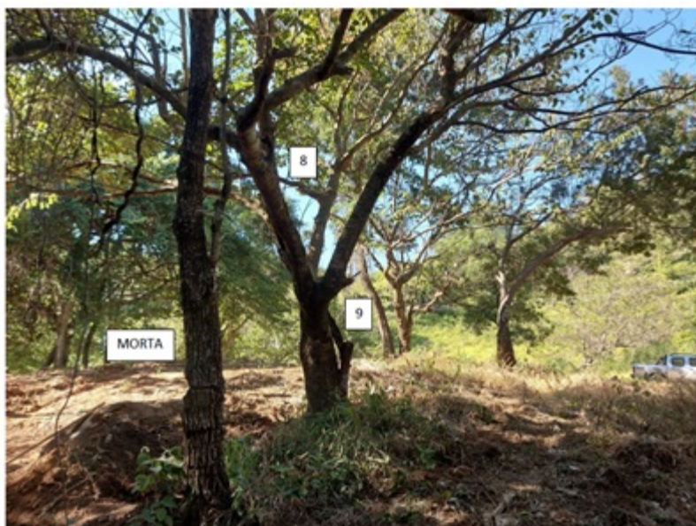
FIGURA 05: Imagem das árvores isoladas nativas na propriedade Gleba Rural 6, bairro Nossa Senhora de Fátima, município de Itajubá/MG, solicitadas para corte ou aproveitamento.