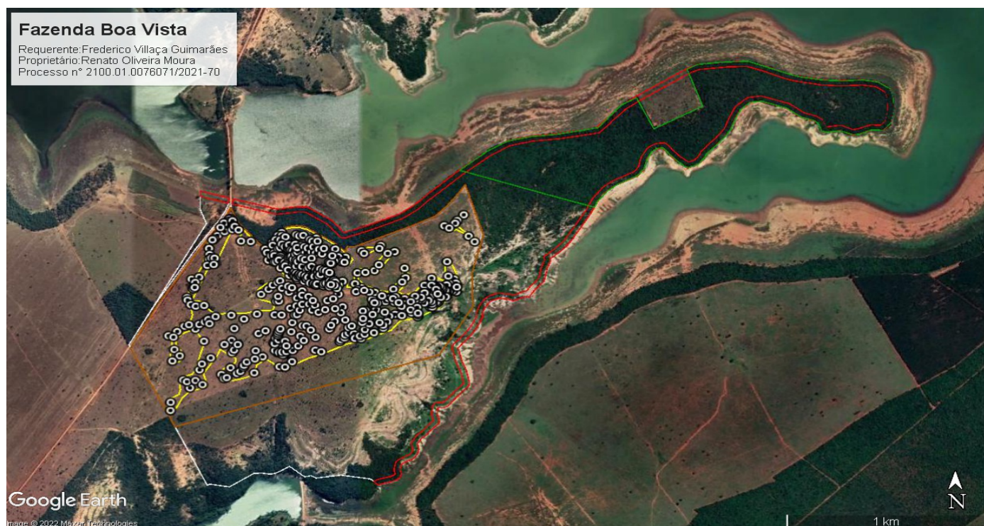
Figura 3: Imagem do Google Earth de 06/09/2021, evidenciando a Fazenda Boa Vista com base nos arquivos digitais georreferenciados disponíveis e no Cadastro Ambiental Rural da propriedade. Em destaque, a área solicitada para intervenção ambiental (polígono amarelo), a