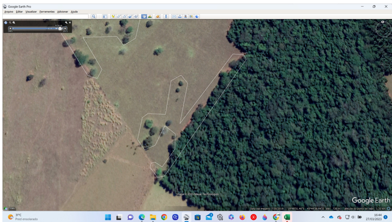
Imagem 2 - Polígono branco demarcando a área requerida.

Desta forma, somo favoráveis ao INDEFERIMENTO do processo por não atender aos critérios de árvores isoladas.