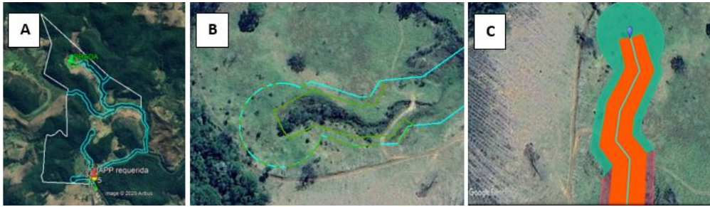
Figura 5. Área de compensação proposta no PRADA, sendo: A) Localização da área do PRADA demonstrada no imóvel rural; B) Área aproximada do Prada; e C) Parte da Planta t proposta no PRADA: