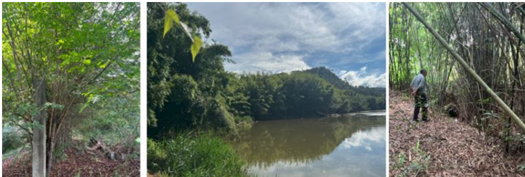
Figura 4. Registros fotográficos realizados durante vistoria no local em 28/05/2025, durante análise do processo intercorrente nº 2100.01.0013100/2025-59, demonstrando alg isolados, no meio dos bambuzais ou em bordas de fragmentos, que não serão cortados:

Figura 3. Registros fotográficos realizados durante vistoria no local em 28/05/2025, durante análise do processo intercorrente nº 2100.01.0013100/2025-59, demonstrando as á APP, sendo as árvores localizadas na "cerca viva" ( Sansão-do-campo - Mimosa caesalpiniaefolia ) e os bambuzais na APP: