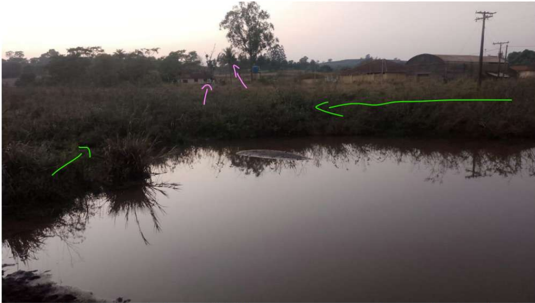
Figura 04. Detalhe do lago artificial com a presença de vegetação arbustiva, sendo necessário o reparo imediato no local.