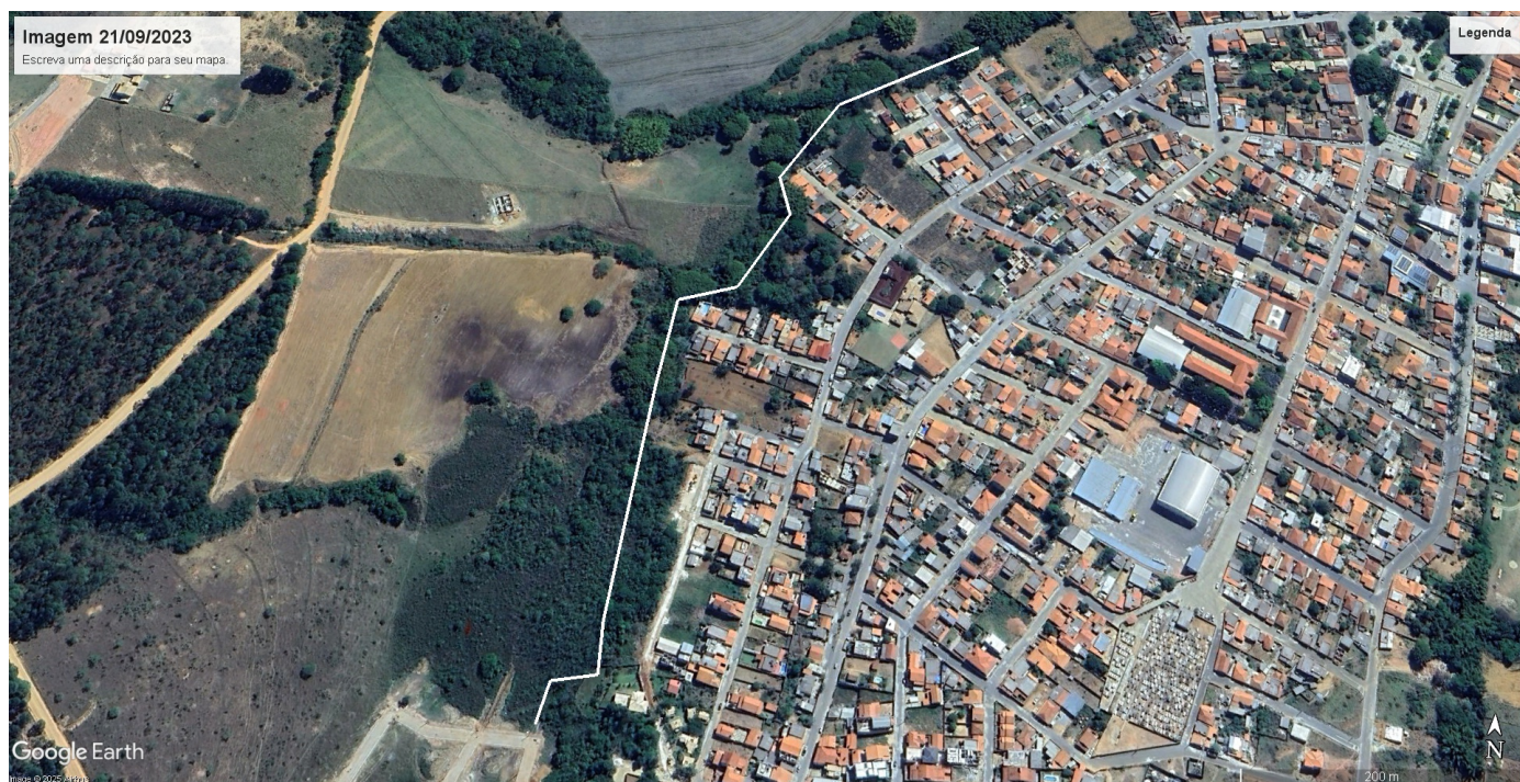
Imagem 02