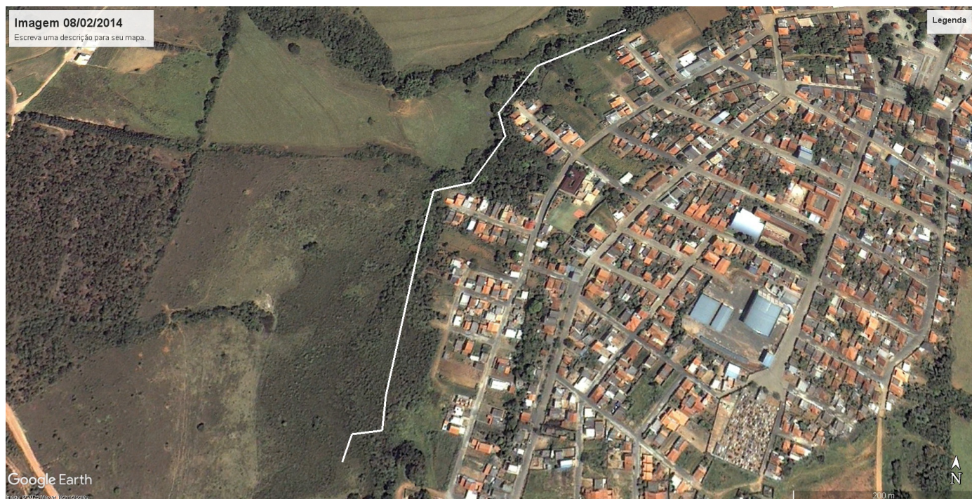
Imagem 01