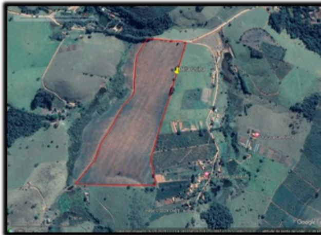
FIGURA 02: Imagens de satélite ano base 2007 e 2019

Taxa de Expediente: R$ 639,69 - Pgto 10/01/2024