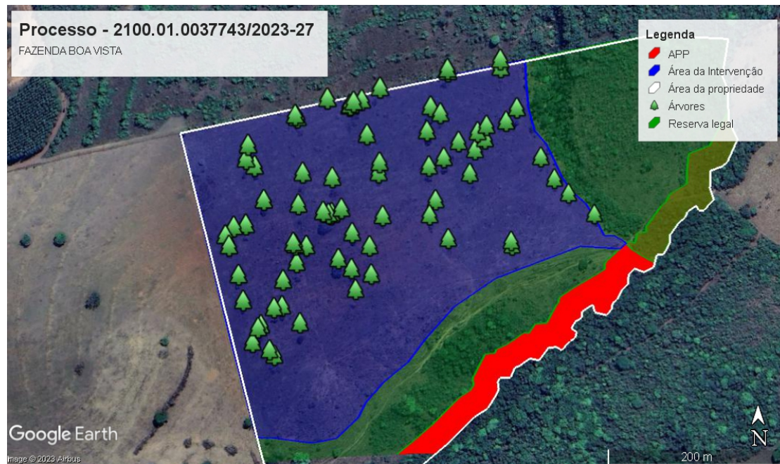
Figura 2: Área da Intervenção.

Taxa de Expediente: Nº 1401281100731, R$ 690,06, pago no dia 02/06/2023