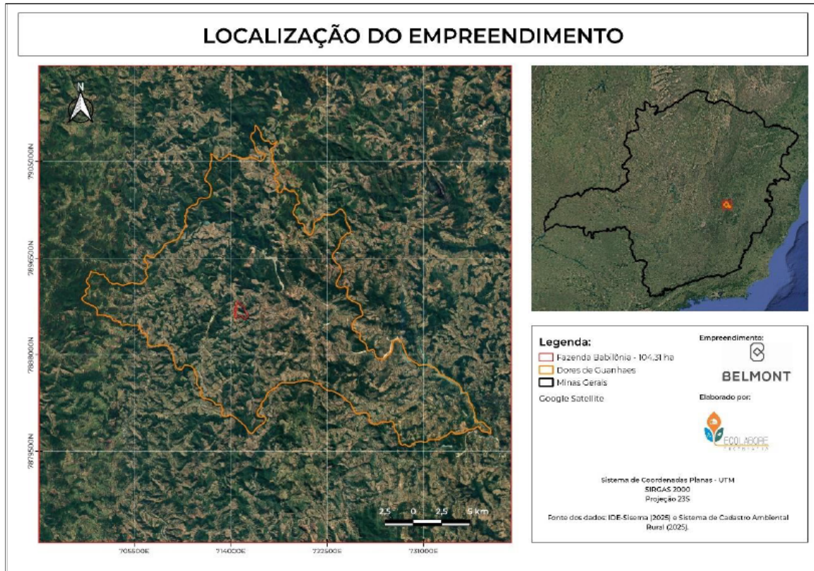
Mapa de localização do empreendimento.

O imóvel está declarado junto ao CAR, conforme recibo nº MG-3123106-3401.82BE.2742.4631.9383.ACA4.DE2A.1D0B, possuindo 600,7480 ha, que é equivalente a 20,0249 módulos fiscais (Doc. SEI 118353365).