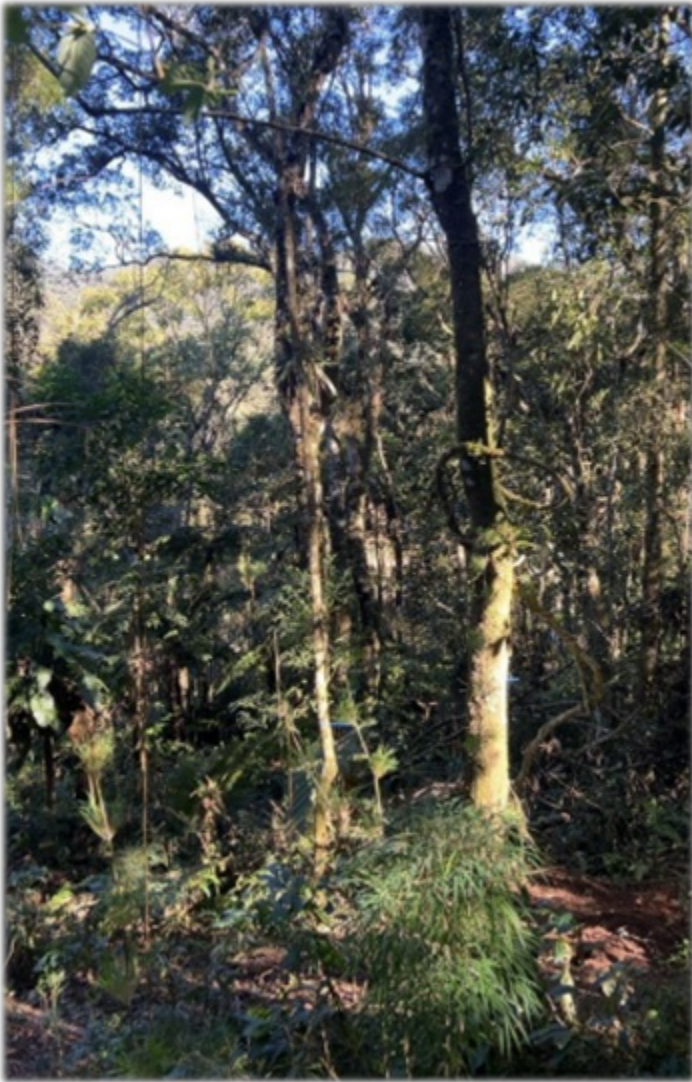
FIGURA 1: Panorâmica do Lote n.º. 13-A, Quadra F, situado à Rua Nogueira, Loteamento Jardim da Represa, Distrito de Monte Verde, Camanducaia/MG.

Conforme definição do Mapa de Aplicação da Lei n.º. 11.428/06, elaborado pelo IBGE e informações constantes no IDE SISEMA, o imóvel lote urbano está localizado nos domínios do Bioma Mata Atlântica. O uso do solo da propriedade é composto por 0,101581 ha de vegetação nativa de porte arbóreo e arbustivo, ou seja, o lote é 100% de mata nativa, conforme quadro de áreas, fotos e vistoria de campo.