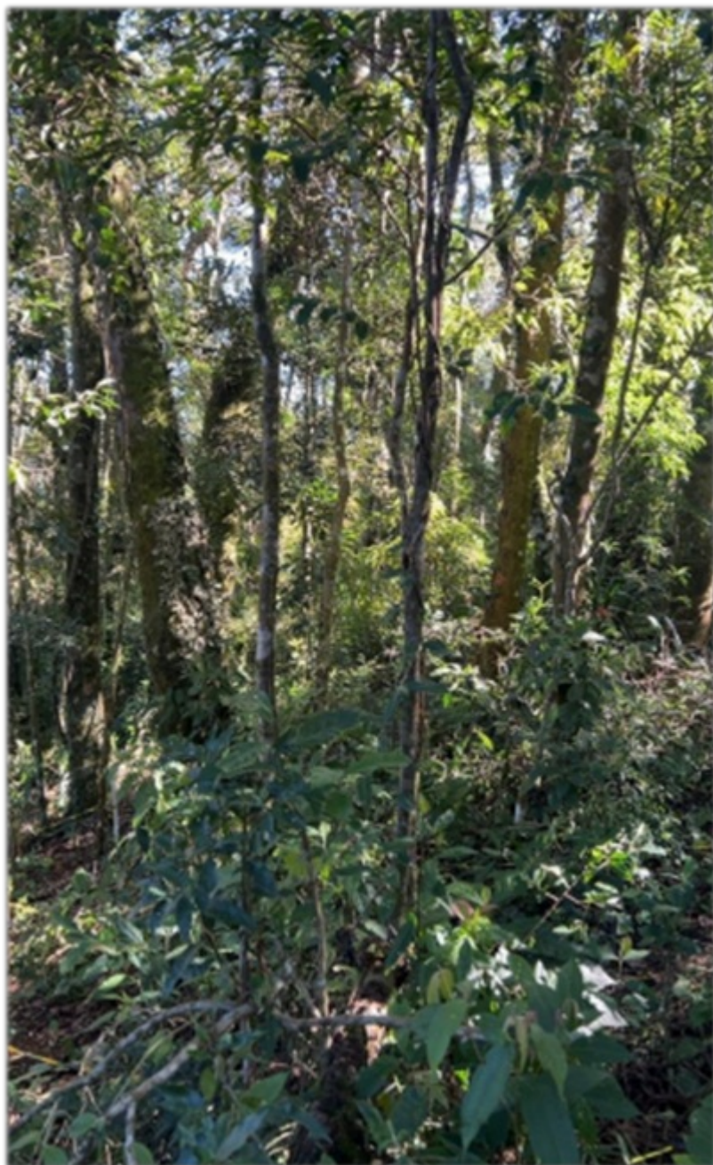
FIGURA 6: Local da área de conservação ambiental presente no Lote n.º. 13-A da quadra F, no Loteamento Jardim da Represa, Distrito de Monte Verde, Camanducaia/MG, na modalidade de servidão florestal.

Foi apresentada, na área da propriedade, a conservação de 50% da cobertura vegetal nativa (Mata), uma área total de 0,0507 ha, coordenadas geográficas (UTM) 395.214 E / 7.470.906 S (Datum: SIRGAS 2000/Fuso: 23 K), existente no local e que não será suprimida, segundo o Art. 55 do Decreto n.º. 47.749 de 11 de novembro de 2019, já que o Loteamento Jardim da Represa foi aprovado anterior a 22 de dezembro de 2006 conforme declaração emitida pela Prefeitura Municipal de Camanducaia/MG, acostada ao processo SEI.