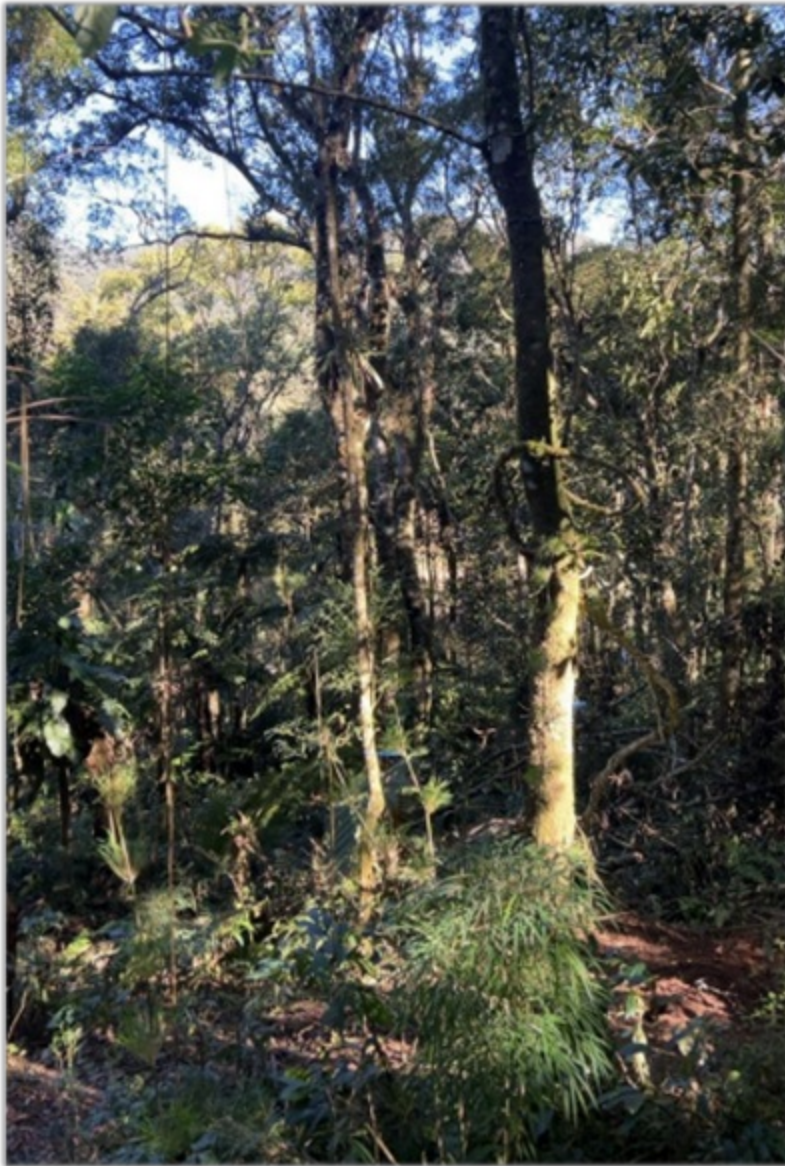
FIGURA 5: Local da intervenção ambiental no Lote n°. 13-A, Quadra F, Loteamento Jardim da Represa, Distrito de Monte Verde, Camanducaia/MG.

A vegetação é composta por fragmento de Mata na área do lote urbano. No local, denominado Loteamento Jardim da Represa, existem casas, rede elétrica, rede de água e coleta de lixo, confirmando se tratar de área consolidada.