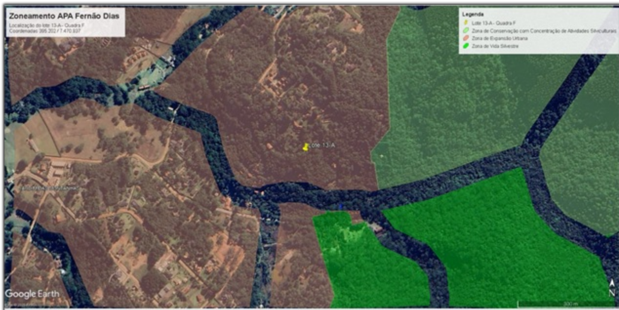
FIGURA 9: Mapa do Zoneamento Ambiental da APA Fernão Dias e a localização do Lote n.º 13-A da quadra F, situado à Rua Nogueira no Loteamento Jardim da Represa, Distrito Monte Verde, Camanducaia/MG.

O Lote n°. 13-A da quadra F, está localizado dentro da Zona de Expansão Urbana (ver imagem abaixo com os limites do Zoneamento da APA Fernão Dias) do município de Camanducaia/MG, portanto a intervenção ambiental em 165 m 2 está inserida na Zona de Expansão Urbana da APA Fernão Dias. Ressalta-se que este local teve seu zoneamento ambiental alterado na última revisão realizada pelo órgão ambiental IEF.