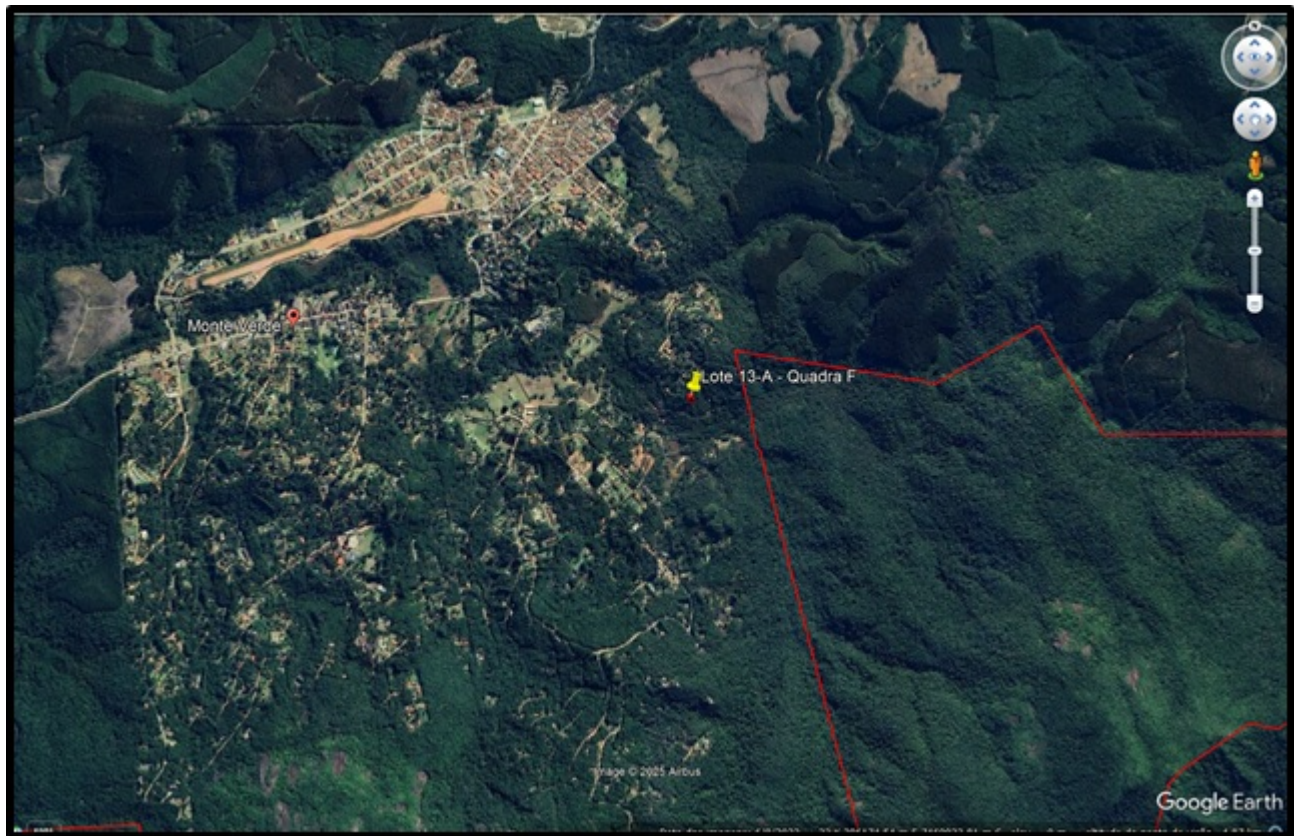
FIGURA 10: Imagem da localização do Lote n.º. 13-A da quadra F, situado à Rua Nogueira, no Loteamento Jardim da Represa, Distrito Monte Verde, Camanducaia/MG, em relação à RPPN Parque Levantina.