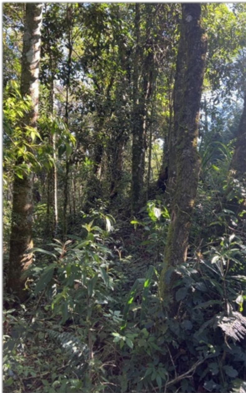
FIGURA 4: Cobertura vegetal nativa em estágio avançado de regeneração natural presente no Lote 13-A da Quadra F, Loteamento Jardim da Represa, Distrito de Monte Verde, Camanducaia/MG.

trepadeiras ocorreram em baixa quantidade e presentes próximas à entrada do lote e foi observado acúmulo de serrapilheira em toda a área do lote.