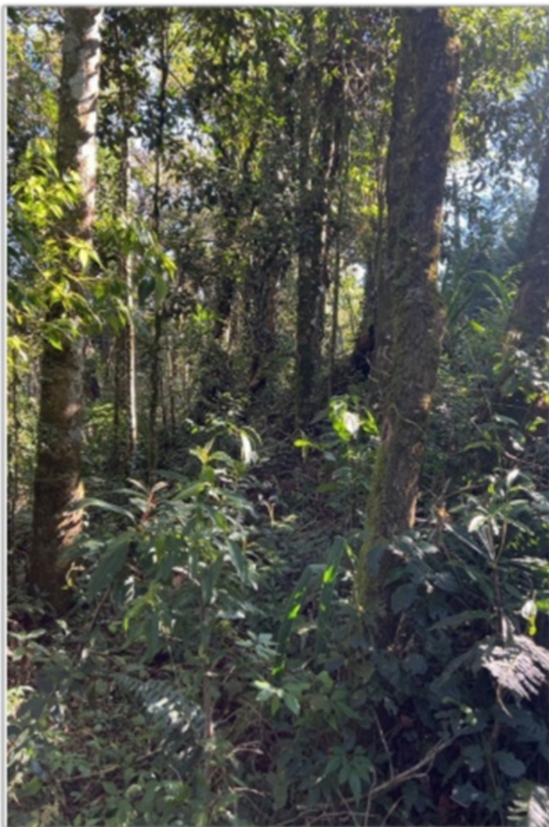
FIGURA 7: Local da área de compensação ambiental presente no Lote n.º 13-A da quadra F, no Loteamento Jardim da Represa, Distrito de Monte Verde, Camanducaia/MG, na proporção de duas vezes a área intervinda e na modalidade de servidão florestal.

As medidas compensatórias apresentadas deverão ser averbadas em cartório de registro, junto à matrícula do imóvel, através de Termo de Compromisso de Compensação Florestal – TCCF.