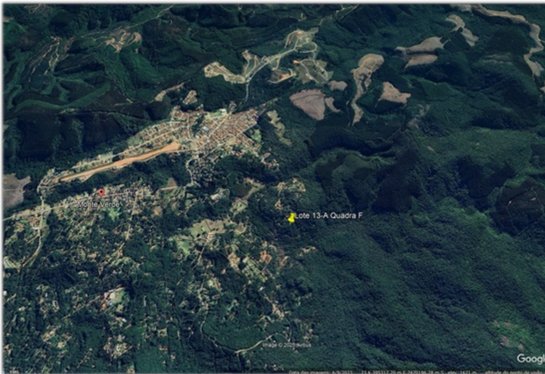
FIGURA 2: Imagem da área do Lote n°. 13-A, Quadra F, situado à Rua Nogueira, Loteamento Jardim da Represa, Distrito de Monte Verde, Camanducaia/MG.

O município de Camanducaia/MG, onde se localiza a propriedade cuja intervenção fora requerida, possui 35,49% de sua área total composta por Flora Nativa, segundo dados do Mapeamento e Inventário da Flora Nativa e dos Reflorestamentos de Minas Gerais do ano de 2005.