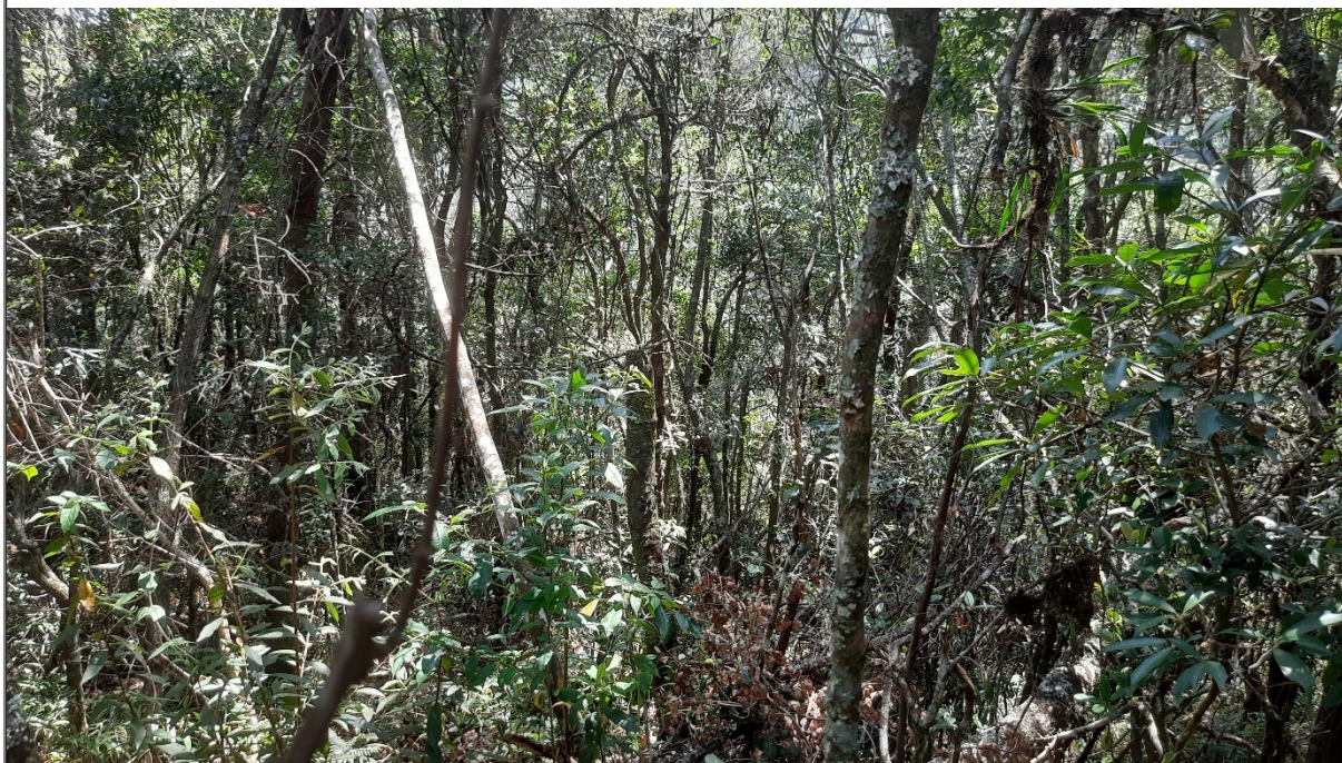
FIGURA 08: Imagem da área de preservação permanente presente na propriedade Sítio São Bernardo,

A Área de Preservação Permanente, presente na propriedade está recoberta por mata nativa classificada como Floresta Ombrófila Montana e gramínea exótica (Braquiária), não se encontra isolada por cerca de arame, em sua totalidade, e há vestígios de animais domésticos de médio e grande porte pastando no local.