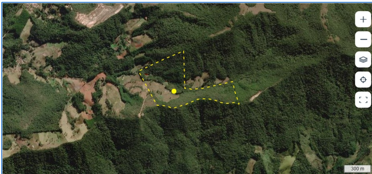
FIGURA 01: Imagem de satélite do Sítio São Bernardo, Bairro São Bernardo, município de Delfim Moreira/MG, contemplado neste parecer.

O objetivo deste parecer é analisar o requerimento para Intervenção Ambiental, com supressão de vegetação nativa, em área total de 04,52,90 ha através da implantação de Plano de Manejo Sustentável da Vegetação Nativa, para a espécie florestal candeia – Eremanthus erythropappus , em um fragmento, na propriedade Sítio São Bernardo, Bairro São Bernardo, no município de Delfim Moreira/MG, em conformidade com os padrões técnicos e legais vigentes.