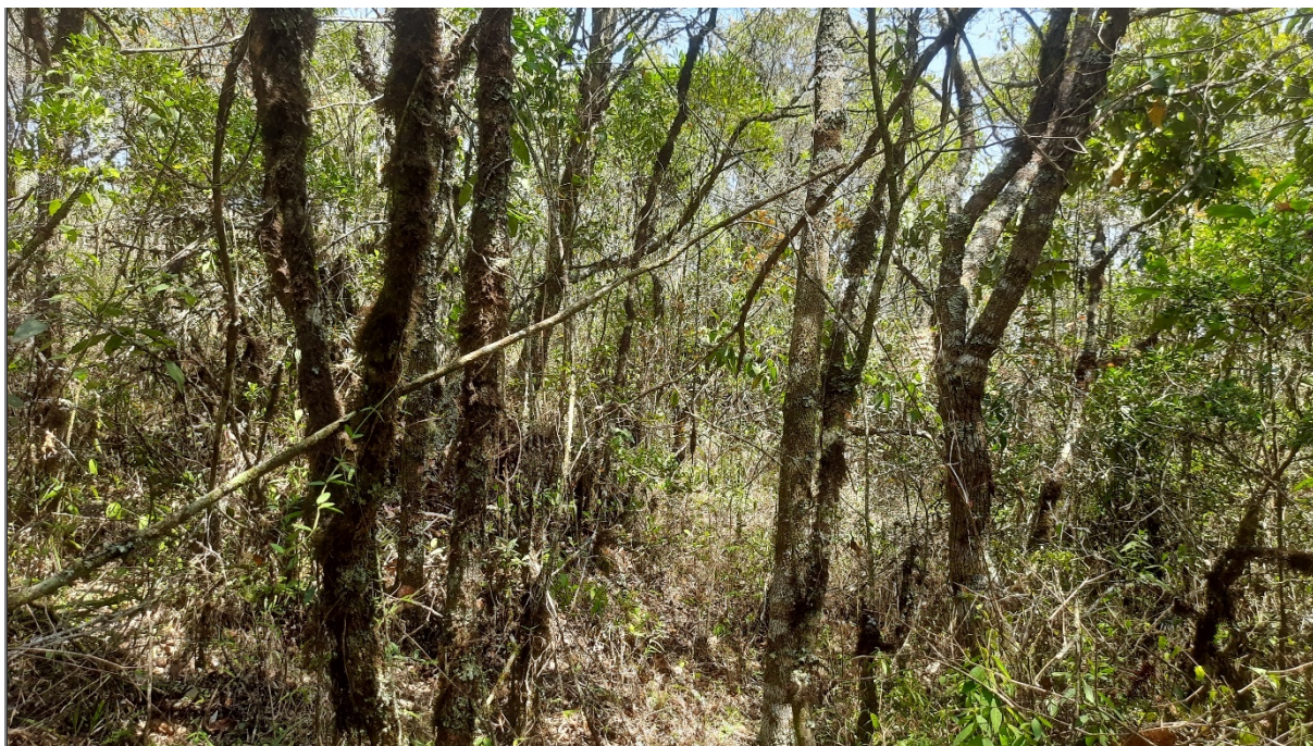
FIGURA 07: Imagem da área requerida para manejo sustentável de candeia na propriedade Sítio São Bernardo, município de Delfim Moreira/MG.