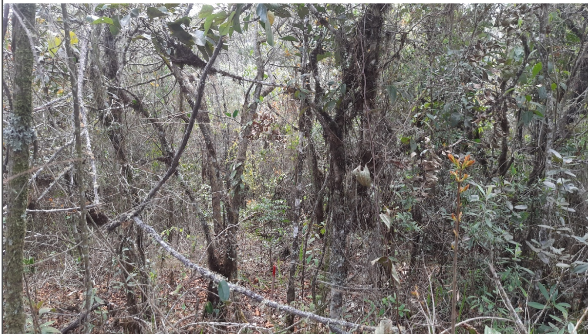
FIGURA 10: Parcela permanente na área requerida para manejo sustentável de candeia, na propriedade Sítio São Bernardo, município de Delfim Moreira/MG.

Na obtenção do volume de candeia do Fragmento requerido realizou-se inventário florestal através de amostragem aleatória simples, onde todas as espécies com DAP maior ou igual a 5 cm foram mensuradas em 8 unidades amostrais, de 600 m 2 cada, distribuídas pela área. Os indivíduos foram identificados como “candeias” (vivas ou mortas) ou “não candeia”. Foi utilizado para a mensuração dos indivíduos fita métrica obtendo-se o CAP dos indivíduos e para a medição da altura fora utilizada vara telescópica graduada retrátil; posteriormente calculado o volume através de equação específica para candeia já que as demais espécies nativas não serão passíveis de exploração.