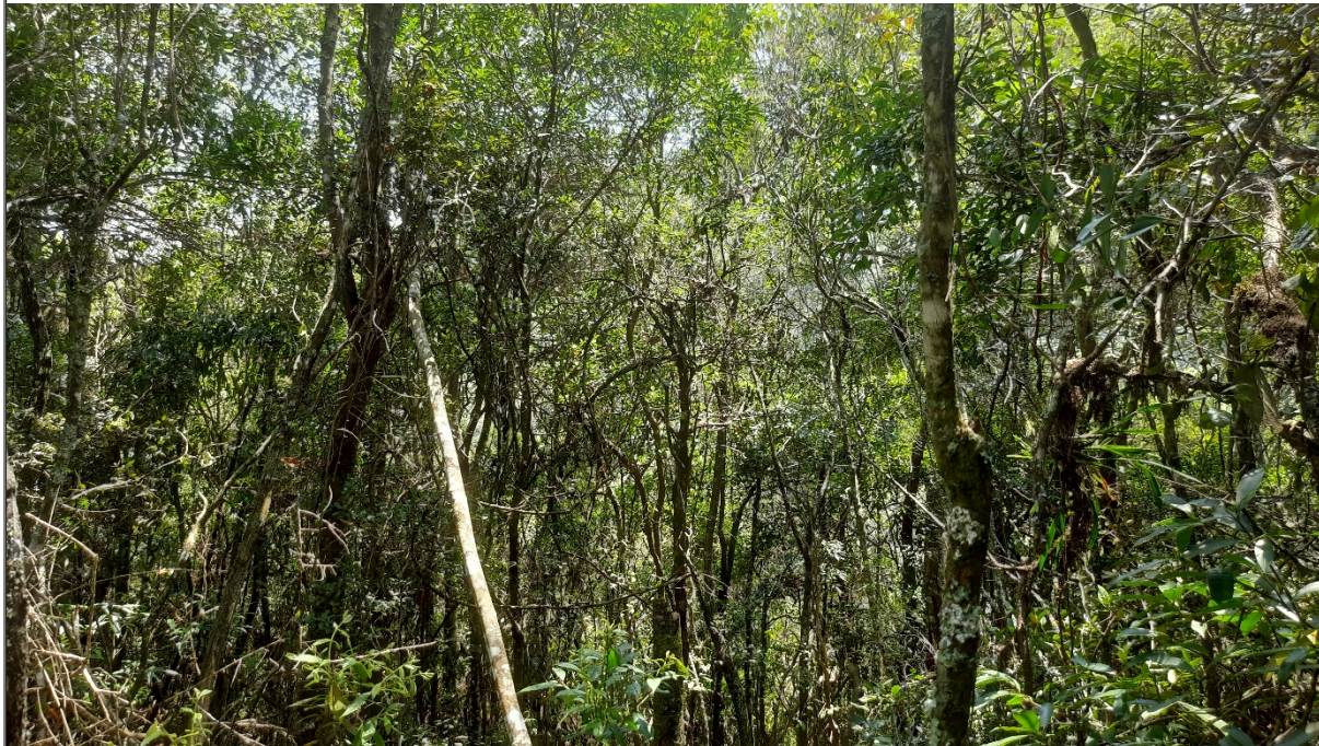
FIGURA 05: Área de Reserva Legal do Sítio São Bernardo, Bairro São Bernardo, município de Delfim Moreira/MG.

A Sítio São Bernardo possui CAR (Cadastro Ambiental Rural), número MG-3121100-D07B.BAEC.8B83.4BF4.8F08.A0F0.DBC7.7B7B, com uma área total considerada Reserva Legal de 6,05,20 ha, a qual é formada por um fragmento recoberto por vegetação nativa arbórea (Mata), classificada como Floresta Ombrófila Montana em estágio médio de regeneração natural. O fragmento não está isolado, em sua totalidade, por cerca de arame e correspondem a 20,00% da área total do imóvel em questão.