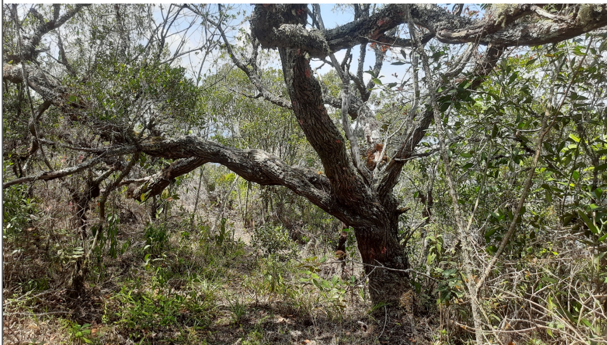
FIGURA 13: Indivíduo porta semente de Candeia ( Eremanthus erythropappus ) na propriedade Sítio São Bernardo, município de Delfim Moreira/MG, que não será cortado.

O Sistema de Exploração adotado é o Sistema de Porta – Sementes com Regeneração Natural, o qual manterá aproximadamente 515 indivíduos porta sementes por hectare, pois a cobertura vegetal do solo é restabelecida com rapidez, além de promover baixíssimo impacto ambiental. A derrubada da madeira será feita com motosserra através de corte em bisel a uma altura de 10 cm. Após o corte, o desgalhamento será feito com machado e foice e o desdobro com motosserra e/ou machado. A madeira será empilhada próximo ao local de abate e será embarcada no cargueiro instalado no lombo dos muares, que irão conduzir a lenha até um pátio de estocagem, sob coordenadas geográficas (UTM) 472.468 E / 7.514.150 S (Datum: SIRGAS 2000/Fuso: 23 K), localizado na mesma propriedade. O transporte do pátio de estocagem até a fonte consumidora será através de caminhões.