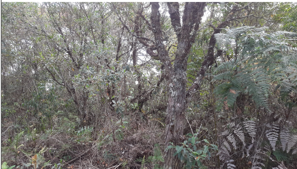
FIGURA 15: Imagem da área requerida para manejo sustentável de candeia na propriedade Sítio São

Em relação ao estágio sucessional de regeneração natural e observando as regras constantes nas legislações ambientais vigentes, a área requerida para candeia mostrou-se em estágio médio de regeneração, condizente com a classificação do responsável técnico.