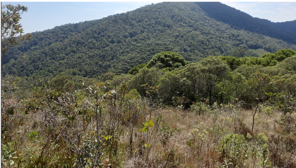
FIGURA 06: Área de Reserva Legal (ao fundo) do Sítio São Bernardo, Bairro São Bernardo, município de Delfim Moreira/MG.

Constatou-se que não foi computada área de preservação permanente como sendo área de Reserva Legal da referida propriedade.