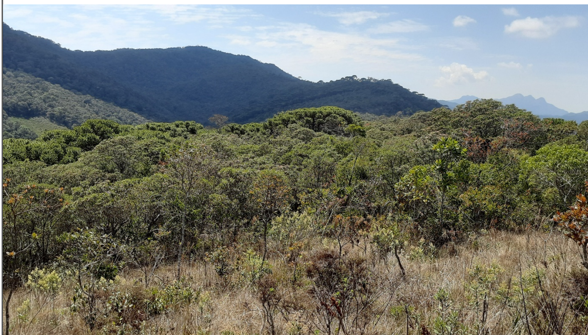
FIGURA 04: Imagem da área sob manejo sustentável no Sítio São Bernardo, Bairro São Bernardo, município de Delfim Moreira/MG.

O uso do solo da propriedade é composto por 00,30,63 ha de estradas, 00,05,81 ha de construções, 04,36,11 ha de pastagem, 20,50,54 ha de vegetação nativa e 04,52,90 ha de candeia, conforme tabela de uso e ocupação do solo acostada ao processo. Possui no interior da propriedade áreas associadas a um curso d'água gerando uma APP total de 04,81,10 ha.