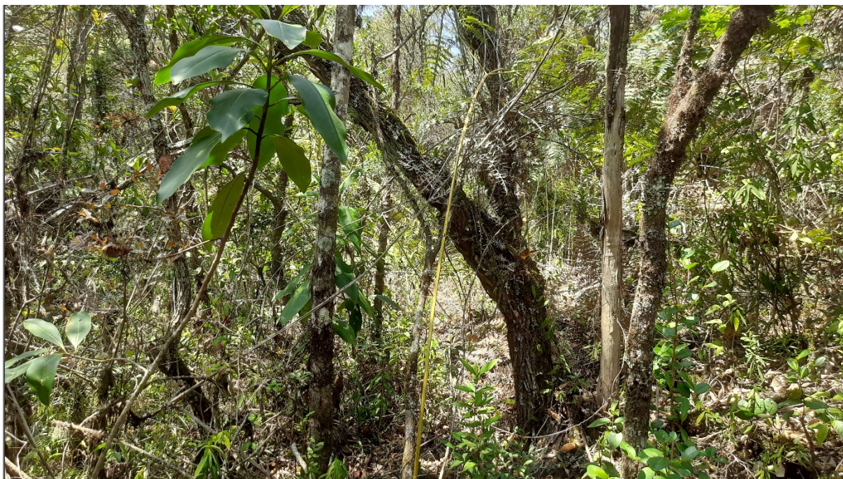
FIGURA 11: Indivíduos de Candea ( Eremanthus erythropappus ) inventariados na propriedade Sítio São Bernardo, município de Delfim Moreira/MG.

Com os resultados obteve-se além do volume da madeira com casca, a estrutura da população florestal para os Fragmentos. A Frequência relativa , que é o resultado de indivíduos com ocorrência da espécie de candeia no fragmento, foi de 100,00% . A d