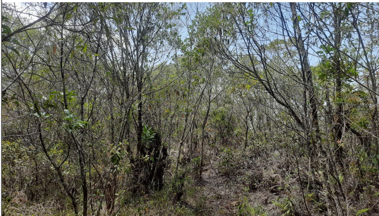
FIGURA 14: Fragmento com predominância da espécie Candeia e formação campestre, Sítio São Bernardo, município de Delfim Moreira/MG.

No que tange à vegetação da área requerida para manejo florestal, a mesma é composta por candeia em sua predominância, com formação campestre na cobertura do solo.