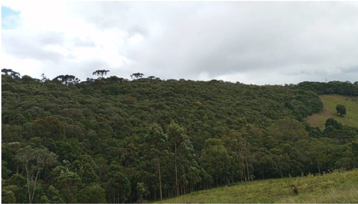
FIGURA 02: Imagem da área sob manejo sustentável no Sítio São Bernardo, Bairro São Bernardo, município de Delfim Moreira/MG.