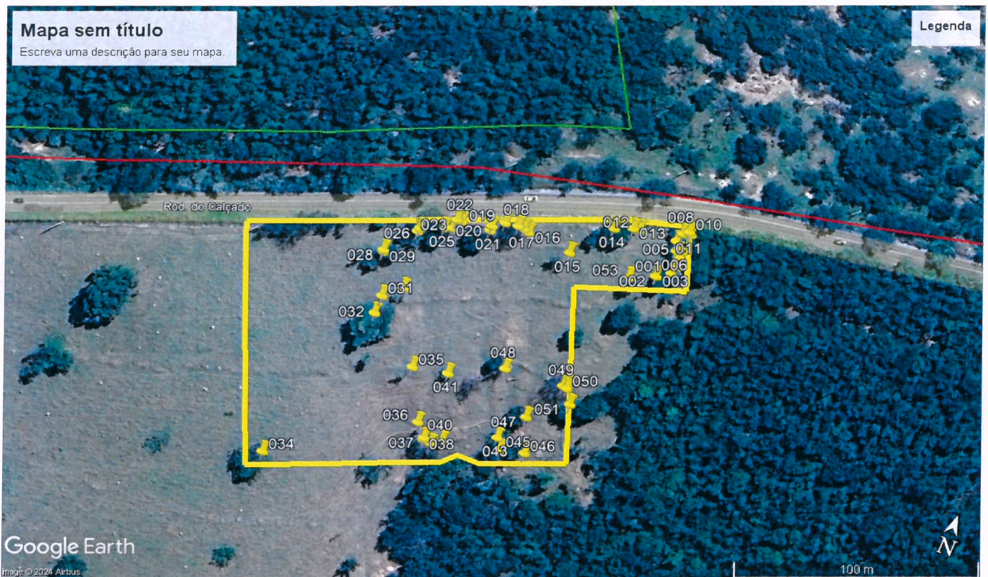
Imagem 01: área pretendida para intervenção ambiental.