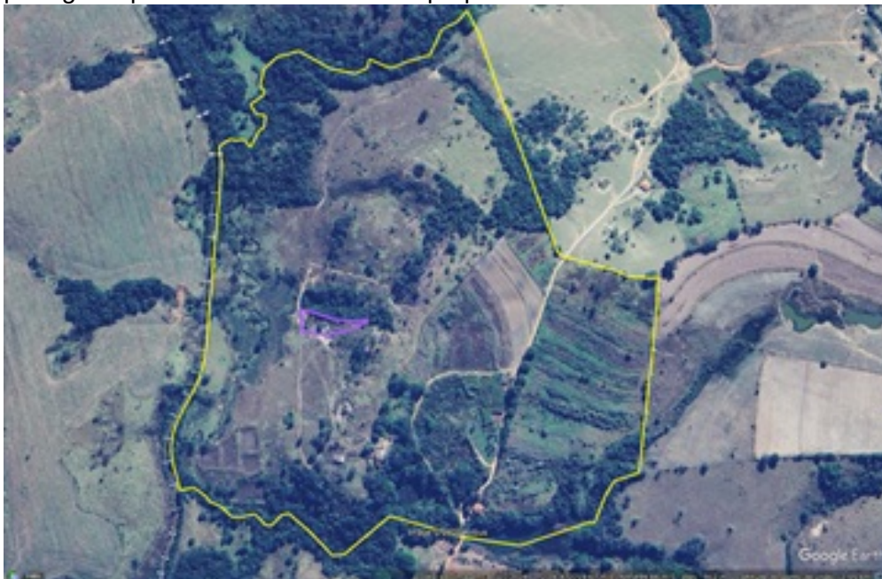
Lengenda: polígono roxo (área de 0,229 ha destinada às compensações acima)

- Imagem da área para execução da compensação pelo corte das espécies ameaçadas de extinção e protegidas por lei + área de iniciativa própria: