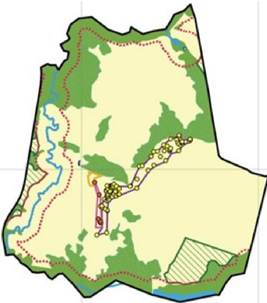
Reserva Legal a recuperar (alvo PRADA) - 1,87 ha