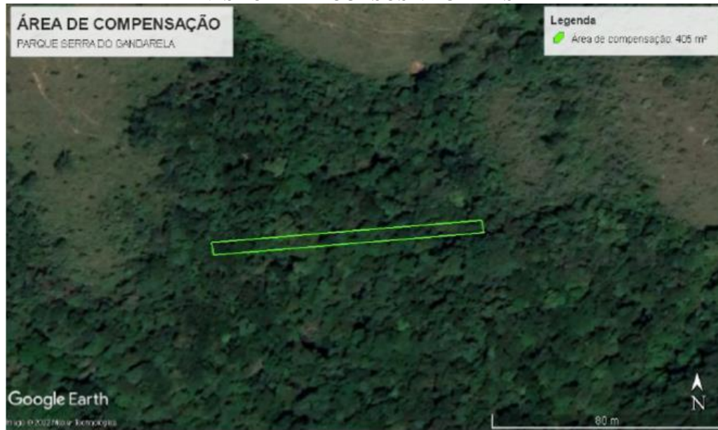
Figura 02 – Poligonal de compensação no Parque Serra do Gandarela.