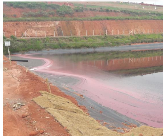
Foto 04. Lagoa Facultativa