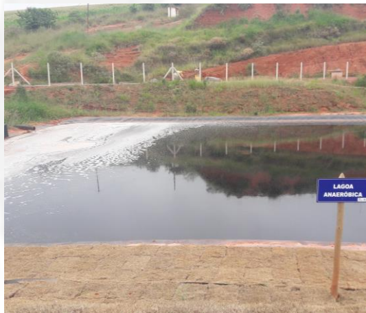
Foto 03. Lagoa anaeróbica de tratamento de efluente