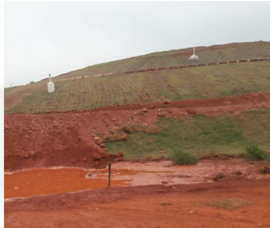
Foto 02. Revegetação de talude